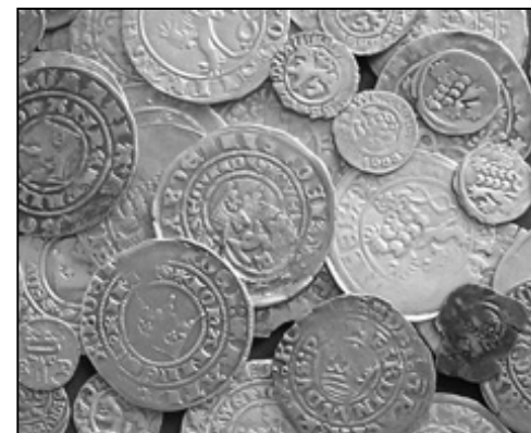
ŠKOLNÍ ZAHRADA PO STALETÍ SKRÝVALA HISTORICKÝ POKLAD

Jak jistě víte, vykopali pracovníci Muzea Královského hvozdu v květnu letošního roku na zahradě základní školy ve Strážově zhruba dvě stovky mincí ze 14. a 15. století. Některé z mincí nalezených zhruba metr pod povrchem jsou navíc nebývalé zachovalé. Malá část pokladu byla ale objevena už v první polovině devadesátých let minulého století, když se kolem školní zahrady stavěla nová opěrná zeď. Nález byl nyní pečlivě zdokumentován a na vše odborně dohlížel doktor Miroslav Hus ze Západočeského muzea v Plzni. Tam také v současné době probíhá důkladné čištění a identifikace jednotlivých mincí.