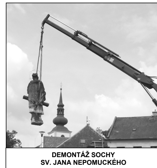
DEMONTÁŽ SOCHY SV. JANA NEPOMUCKÉHO