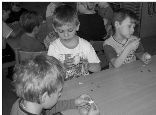
DĚTI Z MATEŘSKÉ ŠKOLY SE PŘI AKCI KNIHOVNY UČILY ZDOBIT VELIKONOČNÍ VAJÍČKA

V jarních měsících se také opět v knihovně scházely zájemkyně do Hobby klubu, kde se uskutečnilo několik zajímavých kurzů – Dekorace dřevěných podnosů, Ketlování a Vosková batika na ubrusy.