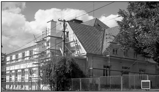
SOKOLOVNA DOSTÁVÁ NOVÝ KABÁT

Občanské sdružení Ekoregion Úhlava je místní akční skupinou, jejíž působnost zahrnuje také správní území našeho města. Pro místní spolky i podnikatelské subjekty se při realizaci místní rozvojové strategie nabízí velice zajímavá příležitost získat finanční prostředky na spolufinancování rozvojových plánů. V rámci čtvrté osy Programu rozvoje venkova se takto letos podařilo dvěma místním