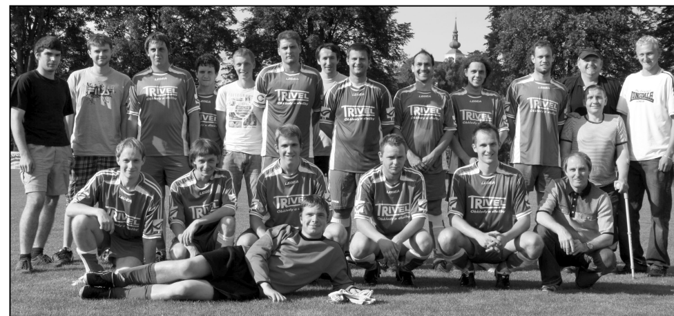
B TÝM SK KOVODRUŽSTVO STRÁŽOV, KTERÝ LETOS POSTOUPIL DO III. TŘÍDY