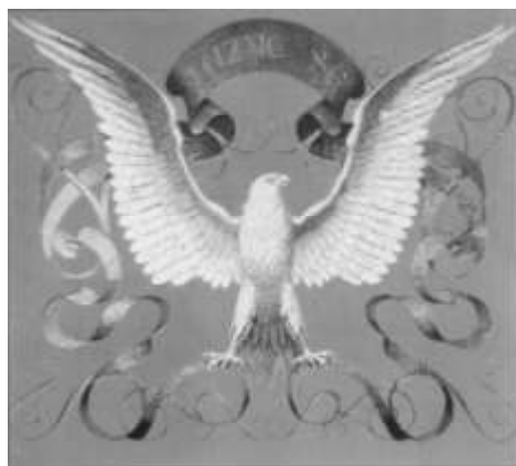
Praporek Právěného Sokola od Josefa Mláčka, 1862 – le

V roce 1902 byly novelizované stanovy ČOS v tom smyslu, že do ČOS mohly vstupovat i moravské jednoty a jednoty z Dolních Rakous. Tím byla vybudována organizační struktura ČOS, ke které se přihlásila ČOS i při své obnově v roce 1990.