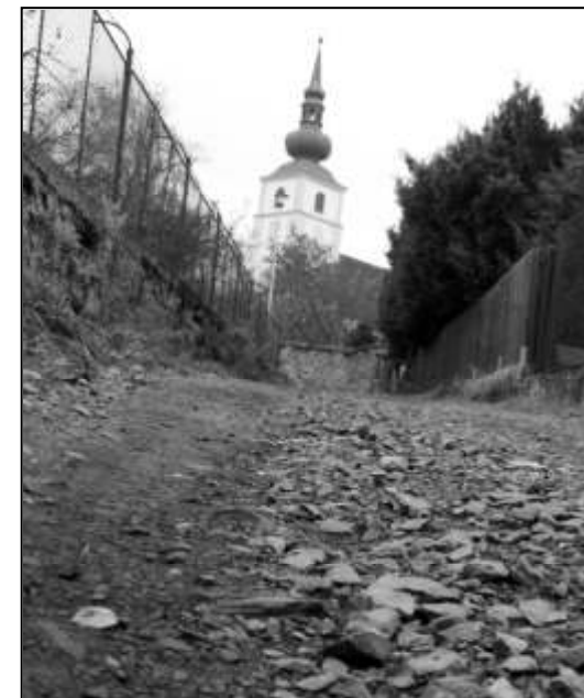
PŘÍVALOVÉ DEŠTĚ POVRCH KOMUNIKACÍ ZNAČNĚ NARUŠILY

Dokončení této části Strážova bude završením několikaletého úsilí o obnovu povrchů ulic a veřejných prostranství v samotném centru Strážova. Za posledních deset let se zde podařilo realizovat několik prospěšných akcí – Jablečná ulice (2003), silniční průtah (2008), první část Hradčan (2010), náměstí a ulice u školy (2011). V souhrnu tak bylo od roku 2003 do technické infrastruktury v této lokalitě investováno cca 35 mil. Kč, přičemž více než 70 % pokryly dotační prostředky. Nebyly to peníze investované jen ve prospěch občanů bydlících v těchto lokalitách, vždyť většinu ulic a veřejných prostranství v centru Strážova využíváme všichni.