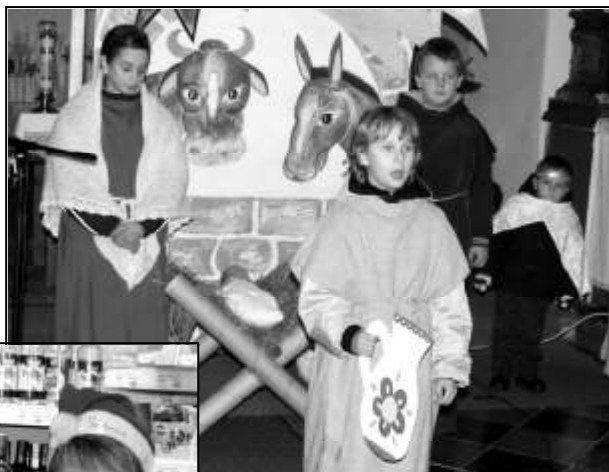
ŽÁCI 3. TŘÍDY NASTUDOVALI VÁNOČNÍ DIVADELNÍ HRU

STRÁŽOV prosinec 2011