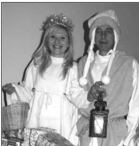
PŘEKVAPENÍM ZPÍVÁNÍ U STROMKU BYL JEŽÍŠEK S ANDĚLY