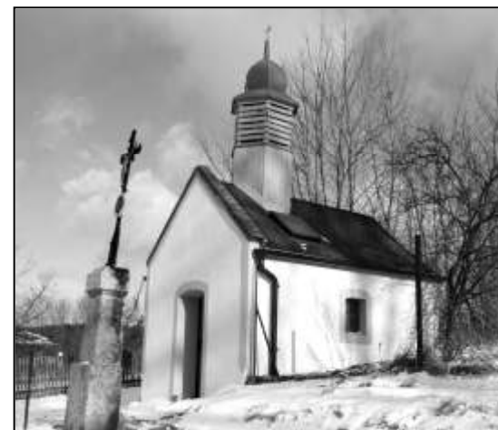
NĚMČICKÁ KAPLIČKA ZÁŘÍ NOVOTOU

Horští hasiči z Němčic pod vedením Zdeňka Koláře se v loňském roce pustili do generální opravy tamní kapličky. Němčický svatostánek se dnes může chlubit kompletně opraveným interiérem včetně nové podlahy ze žulových desek a stropu. Pečlivě bylo provedeno kompletní odvodnění stavby a osazeny nové dveře. Za vším stojí desítky hodin brigádnické práce místních dobrovolníků. Až se někdy zatouláte do Horních Němčic, určitě nám dáte za pravdu, že nově opravená kaplička je perlou tamní kruhové návsi. Všichni, kteří se na opravě podíleli, zasluží veliké poděkování.