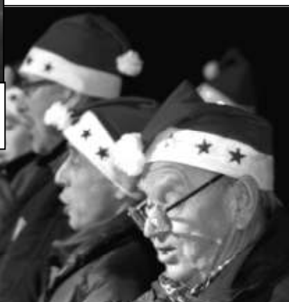
U STROMKU ZAPĚL STRÁŽOVSKÝ SMÍŠENÝ SBOR