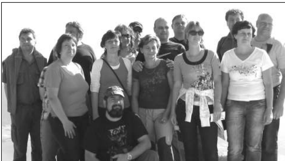
SPOLEČNÁ FOTOGRAFIE ROVENSKÝCH HASIČŮ NA VRCHOLU SCHAFBERGU

Pro velký úspěch a hojnou účast jsme se rozhodli i letos uspořádat další třídní výlet na nejkrásnější ledovec v masivu Mont Blanc.