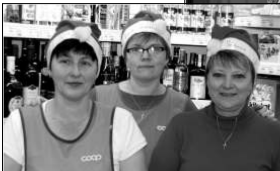
STYLOVÉ VÁNOČNÍ ČEPIČKY NOSIL V ADVENTNÍ DOBĚ TAKÉ PERSONÁL MÍSTNÍHO OBCHODU