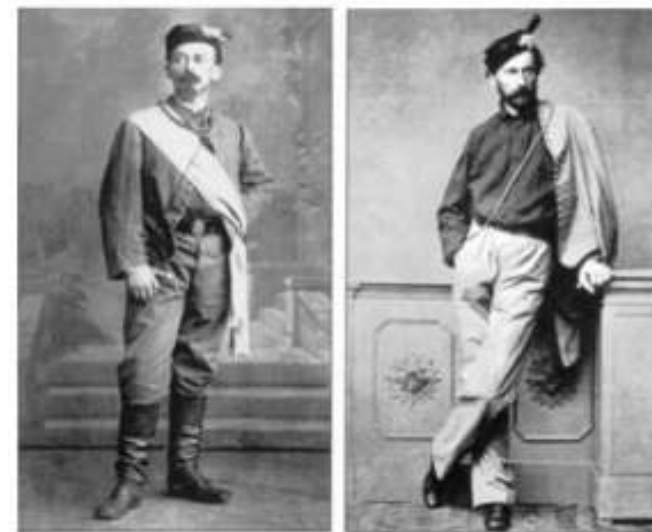
Dr. Miroslav Tyrš

Jméno Sokol bylo přijato oficiálně až o 2 roky později (svým hrdinům tak říkali Jihoslované). V témže roce 9. prosince 1864 byl vysvěcen první sokolský praporek dle návrhu Josefa Mánesa, osobně ho jednotě předala Karolina Světlá. Členové si říkali „bratře“. Pozdrav „Nazdar“ vznikl zkrácením hesla „Na zdar důstojného Národního divadla“ provázející sbírku. V roce 1882 byl přijat návrh na sokolský kroj od Františka Ženíška.