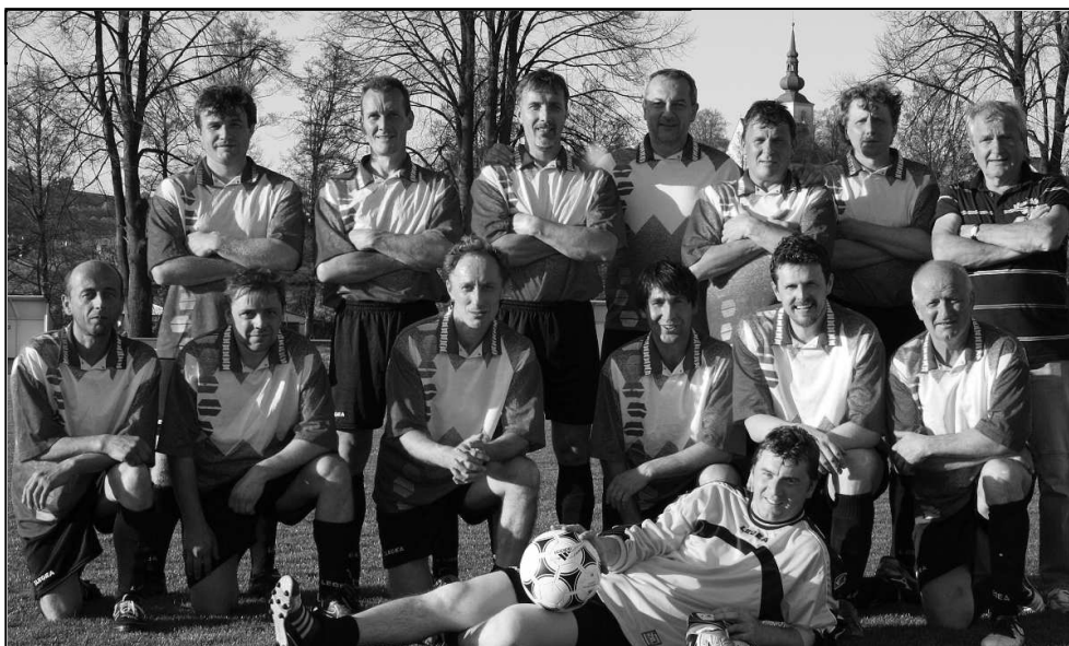
STARÁ GARDA, KTERÁ HÁJILA BARVY STRÁŽOVSKÝCH V POUŤOVÉM UTKÁNÍ