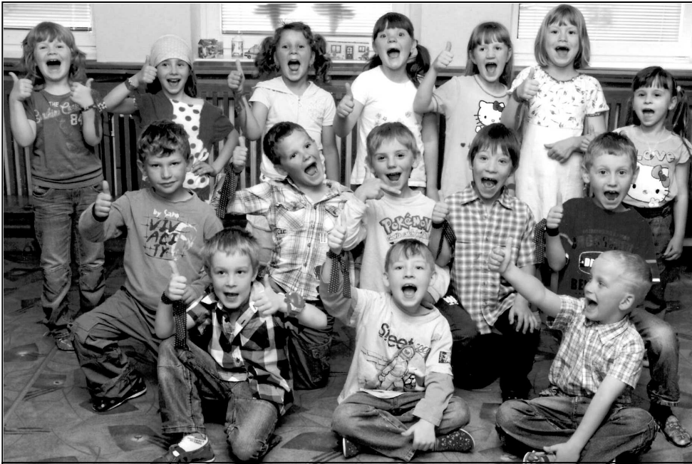
AHOJ ŠKOLKO, ŠKOLA VOLÁ! – NAŠI BUDOUCÍ PRVNÁČCI