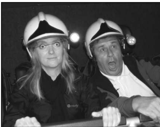
DO ROLE ZASAHUJÍCÍCH HASIČŮ SE NAPLNO VŽILI KOMISAŘI PŘI JÍZDĚ TATROU STRÁŽOVSKÝCH HASIČŮ

V neděli 2. září 2012 navštívila Strážovsko třináctičlenná hodnotitelská komise celostátního kola soutěže Vesnice roku, kam jsme postoupili jako reprezentanti Plzeňského kraje. Během čtyřhodinového časového limitu jsme měli možnost zástupcům ministerstev a dalším odborníkům z řad státní správy a samosprávy prezentovat Strážovsko. Samozřejmě jsme se pochlubili opraveným náměstím a uličkami na Hradčanech. Svou činnost představila místní knihovna, školka, škola i některé spolky (hasiči, myslivci, fotbalisté). Zvláštní ohlas měla prezentace tradiční výroby strážovských krajek, kterou předvedly děti z kroužku paličkování. V rámci projížďky po obci se bohužel komisařům porouchal autobus, takže zbytek dne nám dopravu zajišťovali místní hasiči. Zážitek některých členů komise z jízdy hasičským speciálem je patrný z přiložené fotografie. O tom, jak se komisi u nás líbilo, budou vypovídat výsledky, jejichž vyhlášení proběhne již tento víkend v Luhačovicích. Konkurence je však velká a samotné vítězství v krajském kole je pro Strážov mimořádným úspěchem.