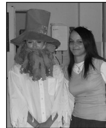
LOUPEŽNÍK RUMCAJS A MAKOVÁ PANENKA PŘI NÁVŠTĚVĚ KNIHOVNY