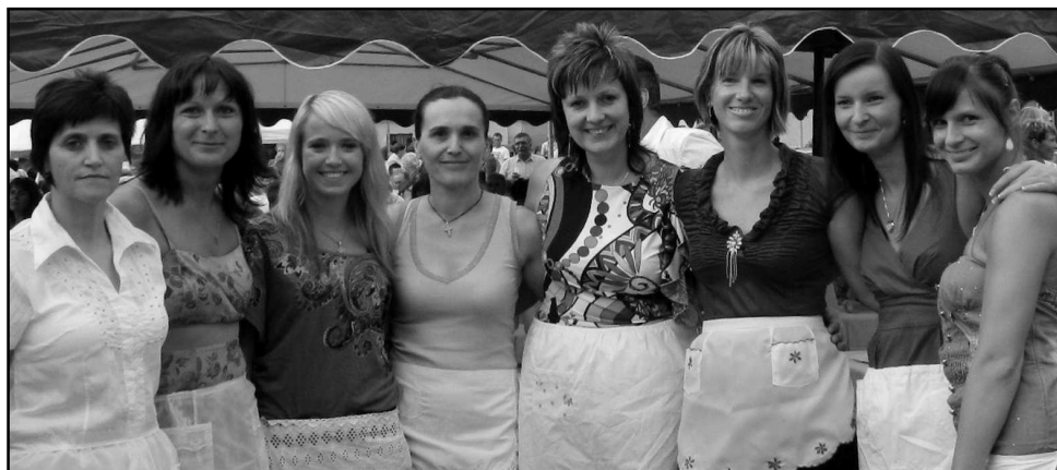
STRÁŽOVSKÁ ŠENKÝŘKO – PIVO – PIVO NALEJ