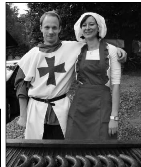
STYLOVĚ OBLEČENÁ BYLA I OBSLUHA U OBČERSTVENÍ

zaměstnanců. V dolní části návsi své umění ukazoval kovářský mistr. V obležení byl také kočár, který nabízel vyhlídkovou projížďku středověkou osadou. Tím rozhodně výčet zdejších atrakcí nekončil a děti, kterých se dle evidence pořadatelů zúčastnilo několik stovek, měly plné ruce práce, aby vše za odpoledne stihly vyzkoušet a zažít. Za vše patří veliký dík pořadatelům a všem, kteří akci podpořili. Velikou radost udělali hasiči ze Zahorčic dětem z janovického Klokánku, které byly na středověkém dni VIP hosty.