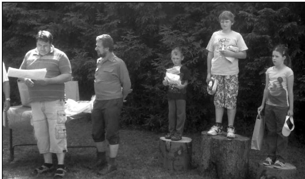
STUPNĚ VÍTĚZŮ PATŘILY JEN A JEN STRÁŽOVSKÝM DĚTEM

Na konci června se na střílnici v Lubech na Výhořici uskutečnila střelecká soutěž dětí z mysliveckých kroužků okresu Klatovy. Pořadatelem akce byl Okresní myslivecký spolek Českomoravské myslivecké jednoty v Klatovech.