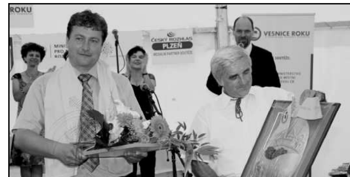
ZLATOU STUHU ZA VÍTĚZSTVÍ V KRAJSKÉM KOLE PŘEVZAL STAROSTA S MÍSTOSTAROSTOU

Poslední červencová sobota letošního roku byla pro Strážovsko významným dnem. Nově zrekonstruované náměstí, které z velké části zakryl velkokapacitní stan, totiž hostilo slavnostní vyhlášení soutěže „Vesnice Plzeňského kraje roku 2012“. Zhruba tisícovka účastníků byla svědkem milého vystoupení dětí ze zdejší mateřské školy, které do svých tanečků zapojily také představitele města, kraje a ministerstev,