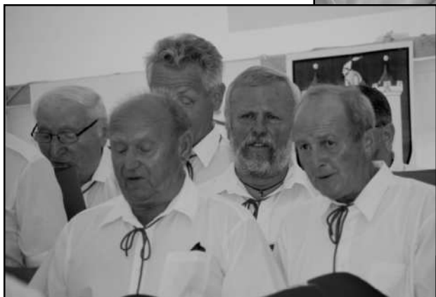
SBOR NEZKLAMAL A SVÝM ZPĚVEM DOJAL STOVKY LIDÍ NA STRÁŽOVSKÉM NÁMĚSTÍ