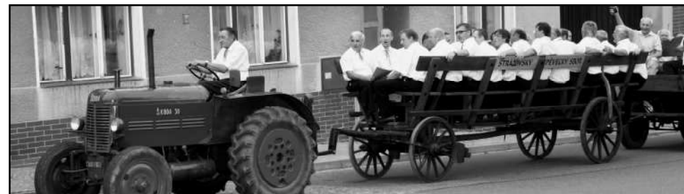
PŘÍJEZD STRÁŽOVSKÉHO MUŽSKÉHO PĚVECKÉHO SBORU

i triumfálního příjezdu a vystoupení strážovského mužského pěveckého sboru. Když zaplněným náměstím zazněly první tóny strážovské hymny, měl nejeden místní patriot slzy na krajíčku. Po oficiálních projevech a zdavicích hostů následovalo předání cen. Strážov získal ocenění dokonce dvě. Komise se nám totiž rozhodla mimo hlavní ceny svěřit také diplom za vzorné vedení místní knihovny. Vyvrcholením příjemného odpoledne bylo převzetí zlaté stuh, která bude zdobit prostory zdejší radnice. Strážováci, kteří se od letoška mohou pyšnit titulem „Vesnice Plzeňského kraje roku 2012“, právem tento úspěch oslavovali do pozdních nočních hodin.