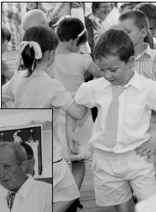
PŮVABNÉ VYSTOUPENÍ DĚTÍ Z MATEŘSKÉ ŠKOLY

STRÁŽOVSKÉ NÁMĚSTÍ 28. července 2012