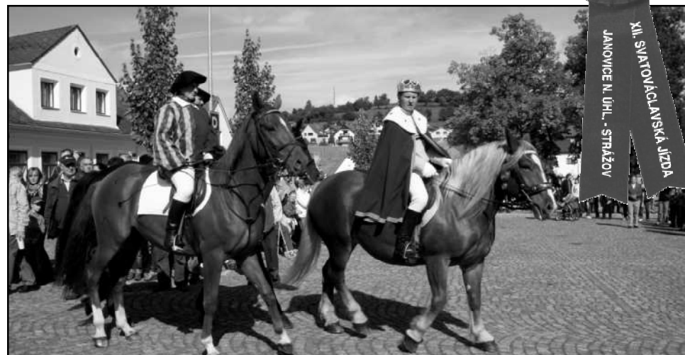
SVATÝ VÁCLAV SE SVÝM DOPROVODEM V JÍZDÍ NA STRÁŽOVSKÉ NÁMĚSTÍ