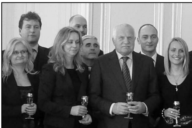
PŘIJETÍ U PREZIDENTA ČESKÉ REPUBLIKY