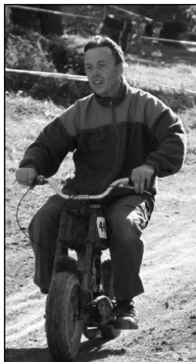
SILNÉ ZASTOUPENÍ MĚLA TAKÉ OBORA