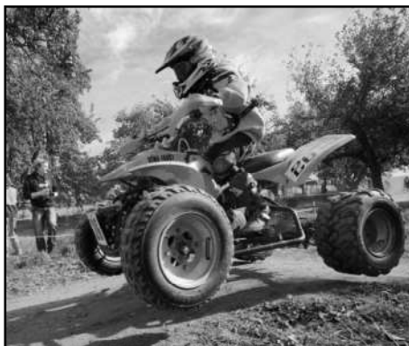
VÁCLAV FAUST ML. NA JEDNÉ Z TERÉNNÍCH PŘEKÁZEK