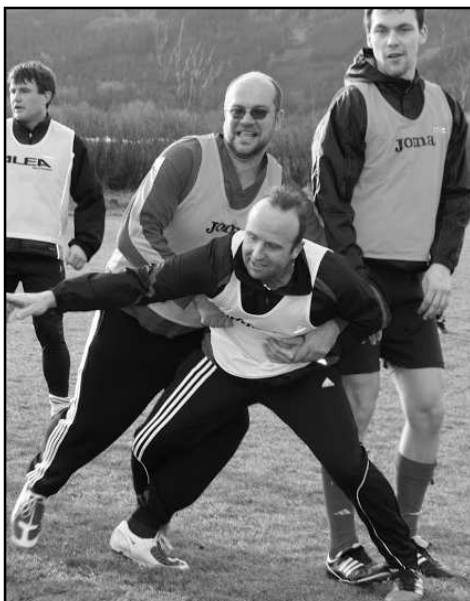
ANI PŘI NOVOROČNÍM PŘÁTELSKÉM FOTBÁLKU SE SOUPEŘI ROZHODNĚ NEŠETŘILI

Tradičně bohatý byl přelom roku na různé zajímavé akce. Ve čtvrtek 13. prosince se v kostele sv. Jiří uskutečnil koncert klavírové ZUŠ J. Kličky "ZA BETLÉMSKOU HVĚZDOU". Tradiční zpívání u vánočního stromku proběhlo v neděli 23. prosince na náměstí. Celý den propršel, avšak těsně před zahájením se počasí umoudřilo a přispělo k úspěchu akce. Nechybělo zde vystoupení místních dětí, naladěný mužský pěvecký sbor, svařené víno ani Ježíšek, jenž tentokrát na strážovské náměstí přijel na saních tažených koněm. Fotodokumentace ze zpívání je na jiném místě našeho zpravodaje. Silvestr byl na Strážovsku opět ve znamení bujarých oslav. V sokolovně tentokrát vyhrávala kapela Ukradený vjegy. První den nového roku se pak již po mnoho let setkávají strážovští fotbalisté všech věkových kategorií v rámci „novoročního fotbalu“. Bez ohledu na výsledek duelu ženatí vs. svobodní zvítězila láska k fotbalu.