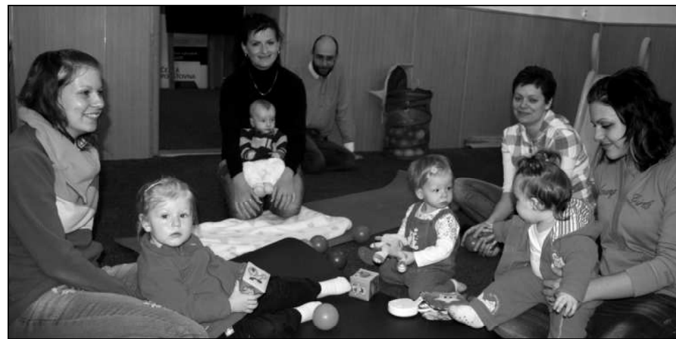
PŘÍJEMNÉ POSEZENÍ DĚTÍ A RODIČŮ V RÁMCI PRVNÍ SCHŮZKY BABY KLUBU

Srdečně mezi sebe zvou i další rodiče, kteří si chtějí dopřát příjemnou změnu v každodenním stereotypu a přijít si s dětmi do klubu zahrát, zacvičit nebo jen tak "pokecat" a podělit se s ostatními maminkami o starosti a radosti související s výchovou dětí. Bližší informace: marketa.furbacherova@seznam.cz nebo tel. 777 906 278.