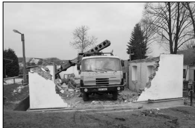
30. BŘEZNA 2013 BYLA ZAHÁJENA ČÁSTEČNÁ DEMOLICE STARÉHO OBJEKTU

Již několik let plánovaná celková rekonstrukce hasičské zbrojnice a klubovny ve Vítěni se pomalu dostává do závěrečné fáze. V podstatě teď již chybí jen finální dokončovací práce, úprava okolního prostoru a venkovní fasáda. Vše by mělo být během letošního roku hotovo. Víteňští hasiči se tak po letech plánování a příprav konečně