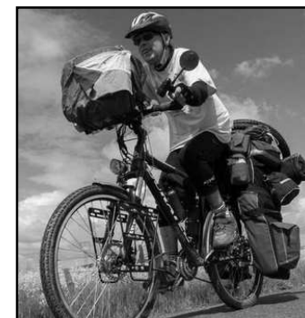
NA CESTĚ KOLEM SVĚTA