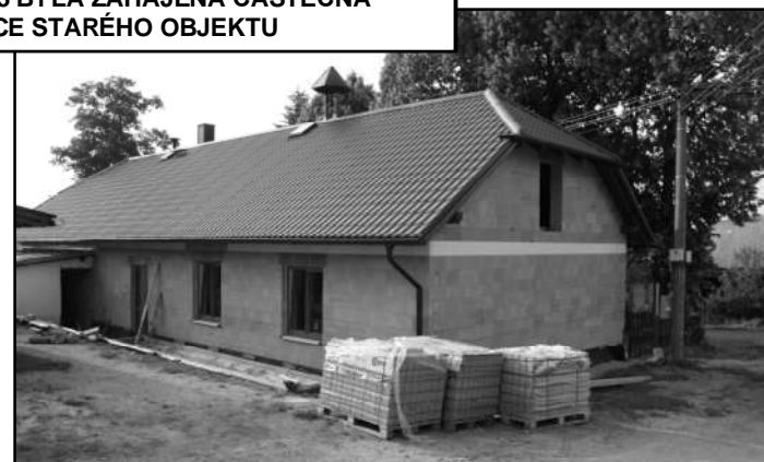
O TŘI MĚSÍCE POZDĚJI JE STAVBA PŘED DOKONČENÍM

Stovky brigádnických hodin zde odpracovávají také členové místního sboru dobrovolných hasičů. Odměnou za odvedenou práci jim budou odpovídající prostory pro spolkovou činnost. Předpokládaný rozpočet akce je cca 2,25 mil. Kč, přičemž 750 tisíc se nám podařilo získat z dotačních programů Plzeňského kraje.