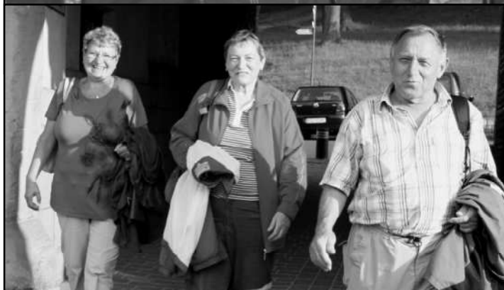
SPOKOJENÍ POUTNÍCI ZE STRÁŽOVA

MŠE SVATÁ BYLA SLOUŽENA TAKÉ V PODZEMNÍM SOLNÉM DOLE