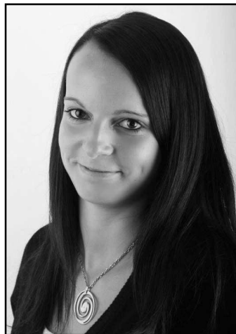
SYMPATICKÁ STRÁŽOVAČKA REPREZENTUJE REPUBLIKU V BELGII