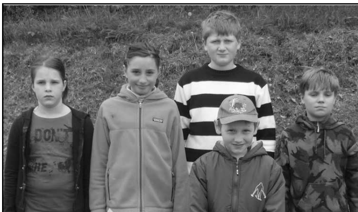
STŘELCI ZE STRÁŽOVA, KTEŘÍ NEDALI SVÉ KONKURENCI SEBEMENŠÍ ŠANCI