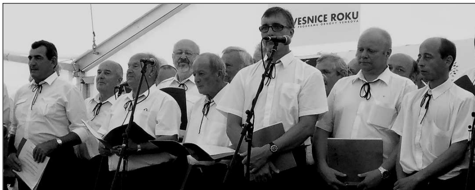
MUŽSKÝ PĚVECKÝ SBOR ZAČÍNÁ PILNĚ TRÉNOVAT POLŠTINU

Ani na svůj domov mužský sbor nezapomíná. Vystoupit se chystá i v rámci připravovaného setkání rodáků na strážovském náměstí.