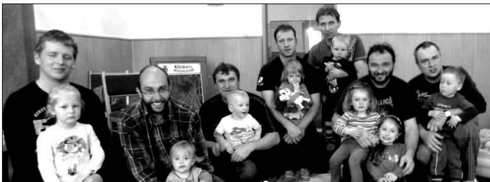
JEDNO SETKÁNÍ STONOŽEK BYLO VÝHRADNĚ V REŽII TATÍNKŮ