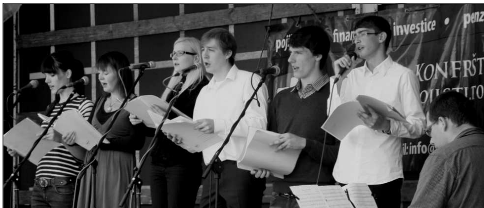
V RÁMCI PIVNÍCH SLAVNOSTÍ VYSTOUPIL TAKÉ SMÍŠENÝ PĚVECKÝ SBOR