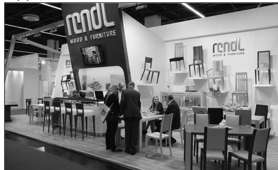
VÝSTAVNÍ PROSTOR FIRMY VLADIMÍR RENDL – TRUHLÁŘSTVÍ Z LUKAVICE

Kvalitní dřevěný nábytek z Lukavice dlouhodobě nachází své zákazníky v tuzemsku i zahraničí. Export jde především do Německa a Rakouska, kde je odběratelem nejen soukromý sektor, ale zejména pak gastronomické provozy (restaurace, hotely, golfové kluby apod.).