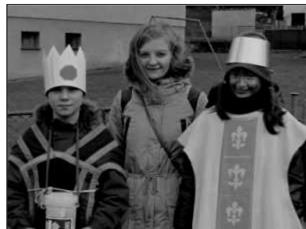
NAŠI LETOŠNÍ TŘÍKRÁLOVÍ KOLEDNÍCI

Při letošní tříkrálové sbírce se ve Strážově vybralo celkem 18 863 Kč. Prostředky z této sbírky jsou tradičně určeny na pomoc lidem nemocným, se zdravotním postižením, seniorům, matkám s dětmi v tísně a dalším jinak sociálně potřebným. Sbírká má předem jasně daná pravidla pro rozdělení výtěžku a je koncipována tak, že naprostá většina vykoledovaných prostředků zůstává v regionu, kde byly vybrány. Předem jsou také stanoveny záměry, na které se v daném roce vybírá.