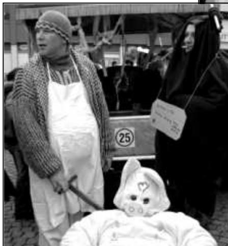
K VIDĚNÍ BYLA TAKÉ TRADIČNÍ OPÁLECKÁ ZABIJAČKA