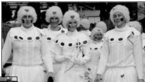
VELICE POČETNÁ BYLA MÍSTNÍ SKUPINKA VALENTINSKÝCH AMORKŮ