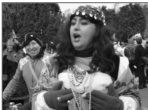
NEPŘEHLÉDNUTELNÁ BYLA BANDA VÍTEŇSKÝCH CIKÁNŮ