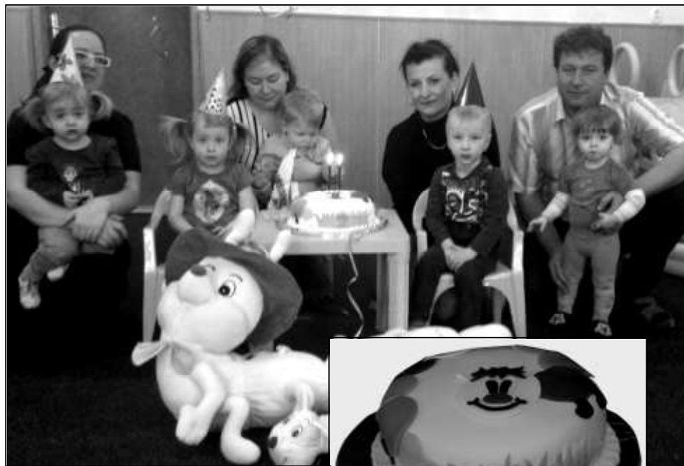
FOTOGRAFIE Z OSLAVY DRUHÉHO VÝROČÍ STONOŽKY A STYLOVÝ DORT, Z KTERÉHO MĚLI VŠICHNI VELIKOU RADOST