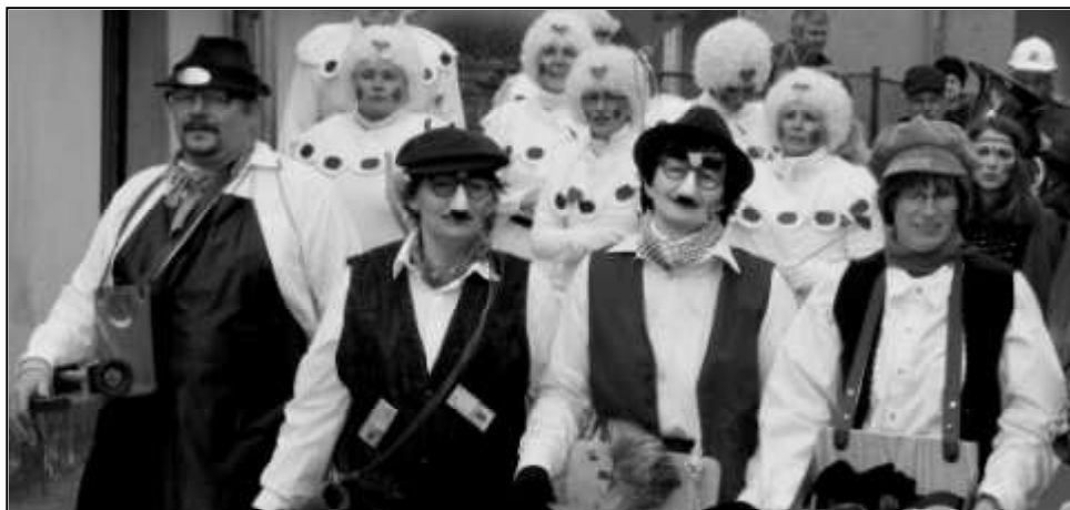
SLUŽBY VŠEHO DRUHU NABÍZELI DRÁTENÍCI Z ROVNÉ