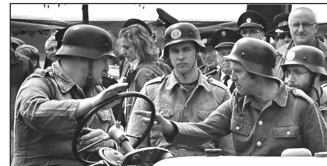
SVOJI HISTORICKOU TECHNIKU PŘEDVEDLI HORŠTÍ HASIČI Z NĚMČIC