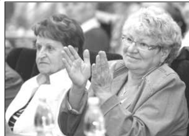
STUDENTKY V U3V PŘI ZÁVĚREČNÉM SEMINÁŘI