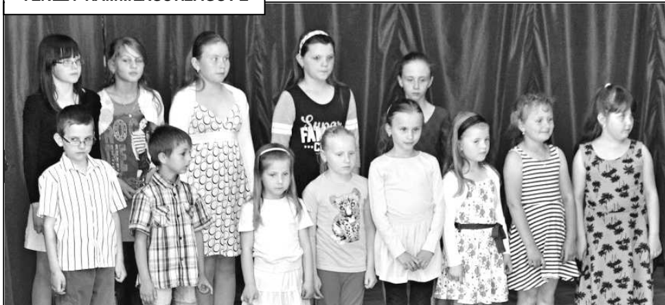
SMÍŠENÝ SBOR SE ROZROSTL NA TŘINÁCT ČLENŮ