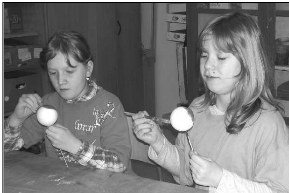
DĚVČATA PŘI VÝROBĚ JARNÍCH DEKORACÍ

Slunce, knihovna a tvoření – Pod tímto sloganem připravila Místní knihovna ve Strážově na zahájení letních prázdnin tvořivé dopoledne pro děti od 6 let. Akce se uskuteční v úterý 30. 6. 2015 od 10:00 hodin v Místní knihovně ve Strážově. Společně si vytvoříme: motýlka z organzy, náramek se jménem, vážku z korálků a záložku. S sebou: pracovní oděv, pití a svačinu. Přihlásit se můžete do 25. 6. 2015 e-mailem: knihovna@strazov.cz, telefonem: 376 382 338 nebo osobně v knihovně. Maximální počet dětí 13.