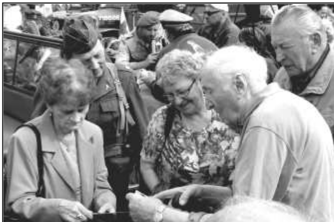
PAMĚTNÍCI VZPOMÍNÁJÍ NAD STAROU FOTOGRAFIÍ

Sedmdesáté výročí od konce druhé světové války a osvobození jihozápadních Čech americkou armádou jsme si připomněli díky koloně historických vozidel se spojeneckými znaky a posádkou v autentických uniformách, která k nám dorazila 4. května 2015. Spolek ČZD Čachrov vydal u této příležitosti zajímavou brožuru s názvem "Z Normandie až na Čachrov ... a dále do Strážova, ke Klatovům a do Kolince", která obsahuje unikátní fotografie z osvobození našeho kraje americkou armádou. Publikace je k dostání také na Městském úřadě ve Strážově.