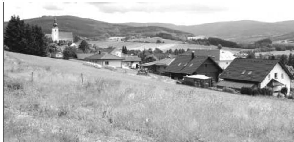
Z NOVÝCH STAVEBNÍCH PARCEL JE PŘEKRÁSNÝ VÝHLED NA STRÁŽOV I ÚDOLÍ MĚSTIŠŤSKÉHO POTOKA S HRADBOU ŠUMAVSKÝCH HOR V POZADÍ

V minulém čísle našeho zpravodaje jsme vás informovali o možnosti rezervace připravovaných stavebních parcel nad cestou k Rovné. Z osmi pozemků určených k výstavbě rodinných domů k trvalému bydlení jsou již tři zmluveny. Máte-li zájem postavit si svůj dům v této hezké lokalitě na jižním svahu Vinného vrchu, určitě neváhejte. Vzhledem ke skutečnosti, že od příštího roku se očekává povinnost navýšení prodejní ceny o daň z přidané hodnoty, je k tomuto rozhodnutí nejvyšší čas. Veškeré bližší informace získáte na Městském úřadě ve Strážově.