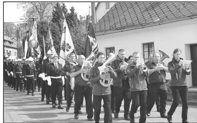
SLAVNOSTNÍ POCHOD S PRAPORY K SOKOLOVNĚ

V sobotu 2. května 2015 proběhly ve Strážově oslavy 140. výročí založení místního hasičského sboru, který patří k nejstarším sborům Klatovska. U příležitosti oslav nechalo vedení sboru zhotovit nový spolkový prapor. A právě v rámci výročních oslav jej v místním kostele požehnal Mons. František Radkovský, biskup plzeňský.