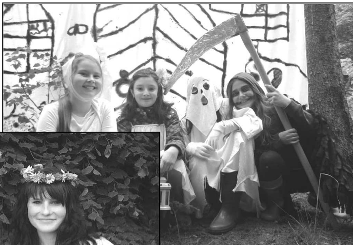
NA TAJEMNÉM HRADĚ

V neděli 24. května 2015 se v lese za Kovodružstvem uskutečnil tradiční pohádkový les. Na děti zde čekalo nepřeberné množství pohádkových postav