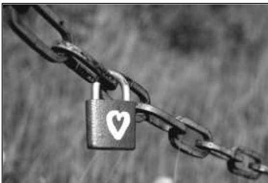
SYM BOL V ĚČ N Ě L ÁSK Y – VIS AC Í Z ÁMEK

❖ Určitě jste již někdy slyšeli o takzvaných mostech lásky přes Seinu v Paříži či přes Čertovku v Praze. Milenci si zde na důkaz věrnosti zamýkají visací zámky . Jeden podobný se před časem objevil při cyklostezce do Brtí. Kdopak jsou asi ti šťastní? Přibude ještě nějaký?