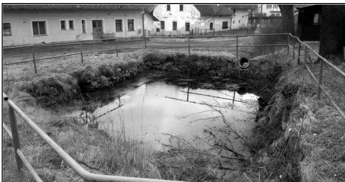
PŮVODNÍ STAV NÁDRŽE

Na podzim letošního roku se lukavická návěs proměnila k nepoznání. V rámci projektu podpořeného v rámci Programu stabilizace a obnovy venkova Plzeňského kraje byla totiž kompletně opravena zdejší požární nádrž. Původní rybníček byl v naprosto havarijním stavu a vzhledem k tomu, že jeho hráz propouštěla, byl poloprázdný a pro požární účely naprosto nepoužitelný. Oprava byla pojata stylově, neboť na její realizaci byly použity žulové kamenné bloky. Práce provedla firma NovaKam z Nových Hradů u Českých Budějovic, která nám byla dobře známá, neboť se