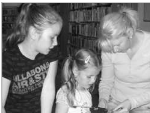
VÍTEŇSKÉ SESTRY TOMANOVY S MAMINKOU V JUNIOR KLUBU

Na začátek letních prázdnin bylo pro děti a mládež v místní knihovně připraveno tvořivé dopoledne. Společně jsme si vyrobili motýlky z organzy, náramky se jménem, vážky z korálků a záložky. V polovině léta proběhla pro děti a mládež akce Slunce, knihovna a hraní. Uskutečnil se turnaj ve stolní hře Člověče, nezlob se! a karetní hře Pexeso. Konec prázdnin se v knihovně uzavřel tvořivým dopolednem. Děti si vyráběly mořského koníka z korálků a plastovou vitráž do okna.