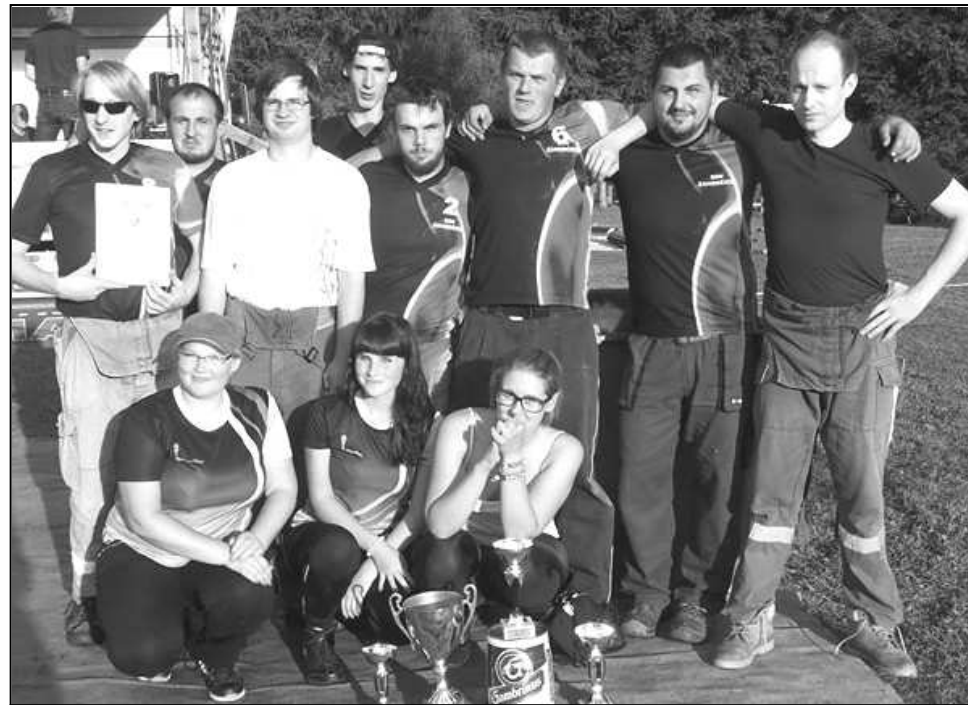
HASIČI ZE ZAHORČIC PO VYHRANÉ SOUTĚŽI V MALÉ VÍSCĚ

Soutěžní družstvo dobrovolných hasičů ze Zahorčic se pravidelně zúčastňuje během sezóny mnoha soutěží. Mimo jiné v letošním roce absolvovali celý seriál Pošumavské hasičské ligy. V celkovém hodnocení skončili na výborném šestém místě, přičemž v jednom kole, které se konalo v Malé Vísce, dokonce zvítězili. Na konci září uspořádali na zahorčické návěsi soutěž s názvem „Záhorčický speciál“. Soutěže se zúčastnilo celkem dvanáct hasičských kolektivů. Čtyři družstva („A“, „B“, ženy, děti) dali dohromady místní. Na soutěžním poli jsou hasiči ze Zahorčic v současné době nejúspěšnějším a nejpilnějším sborem z celého našeho hasičského okrsku.