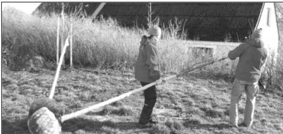
LÍPY PO STALETÍ KE KOSTELU VE STRÁŽOVĚ PATŘILY A PATŘIT BUDOU NADÁLE

V sobotu 21. 11. 2015 bylo okolo kostela vysázeno osm nových lip. Pro výsadbu byl zvolen kultivar Greenspire, což je lípa srdčitá menšího vzrůstu. Náhradní výsadbou byl splněn slib, který jsme dali při kácení původních rizikových stromů. Na výsadbu nového stromořadí podstatnou částkou přispěl Plzeňský kraj.