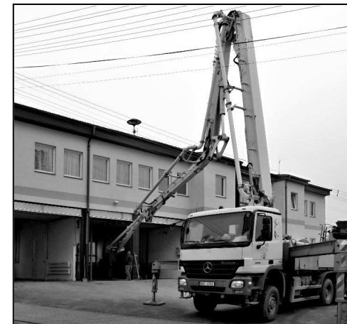
BETONOVÁNÍ PODLAHY GARÁŽÍ SDH STRÁŽOV

Část bouracích prací provedli místní hasiči svépomocí. Stavební část realizovala firma Klatovská stavební společnost. Rozpočet akce přesáhl 380 tisíc korun, přičemž čtvrt miliónu korun poskytl ze svého rozpočtu Plzeňský kraj.