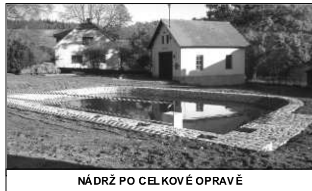
NÁDRŽ PO CELKOVÉ OPRAVĚ

subdodavatelsky již podílela na dláždění uliček na strážovských Hradčanech. Celkové náklady přesáhly 650 tisíc korun, přičemž 250 tisíc korun pokryl finanční příspěvek z krajského rozpočtu.