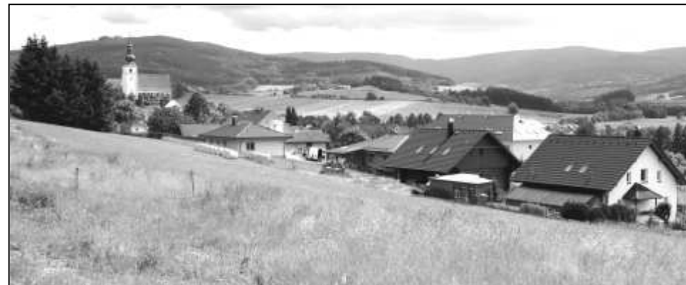
NOVÉ STAVEBNÍ PARCELY NABÍZÍ ÚŽASNÝ VÝHLED

Na zářijovém zasedání zastupitelstva byl schválen prodej dalších třech stavebních parcel nad cestou k Rovné. Z osmi nově zainvestovaných pozemků určených k výstavbě rodinných domů k trvalému bydlení budou mít tři již brzy své majitele. Další pozemek je zamluven a jeho prodej bude schvalován na zastupitelstvu v polovině prosince. Máte-li zájem postavit si svůj dům v této hezké lokalitě na jižním svahu Vinného vrchu, určitě neváhejte. Vzhledem ke skutečnosti, že od příštího roku se očekává povinnost navýšení prodejní ceny o daň z přidané hodnoty, je k tomuto rozhodnutí nejvyšší čas. Veškeré bližší informace získáte na Městském úřadě ve Strážově.