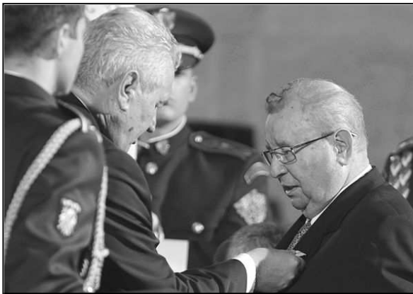
SLAVNOSTNÍ UDĚLENÍ MEDAILE ZA ZÁSLUHY V PROSTORÁCH VLADISLAVSKÉHO SÁLU NA PRAŽSKÉM HRADE

U příležitosti státního svátku 28. října 2015 obdržel rodák z Vítň Ing. Miroslav Toman, CSc., z rukou prezidenta republiky medaili Za zásluhy. Toto ocenění se uděluje jako vyznamenání osob, které se zasloužily o stát. Miroslav Toman se narodil ve Vítňi v roce 1935. V osmdesátých letech minulého století byl místopředsedou vlády a ministrem zemědělství a výživy Československa. Nyní se spolu se svým synem věnuje podnikání v potravinářském průmyslu a volný čas tráví na své rekreační chalupě v Horních Němčicích.