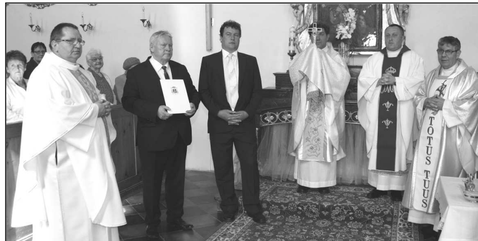
SLAVNOSTNÍ PŘEVZETÍ RELIKVIÍ V KOSTELE SV. JIŘÍ