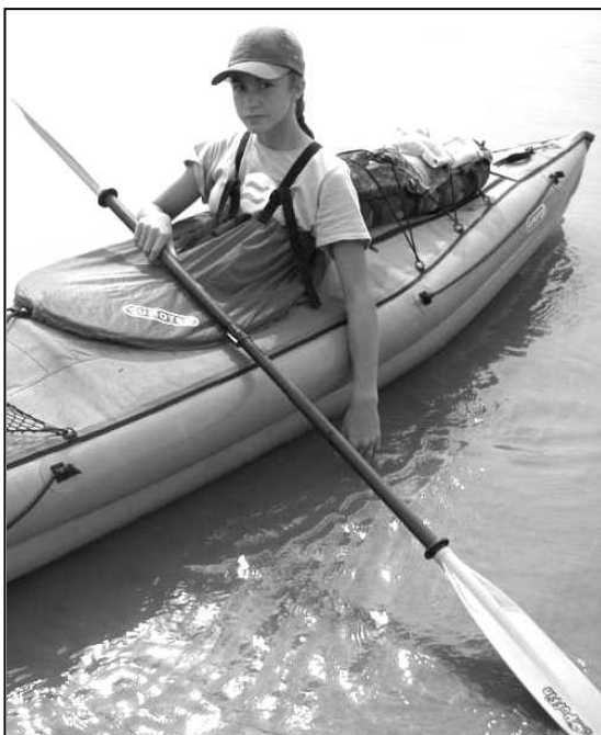
EXPEDICE BYLA VELMI FYZICKY NÁROČNÁ