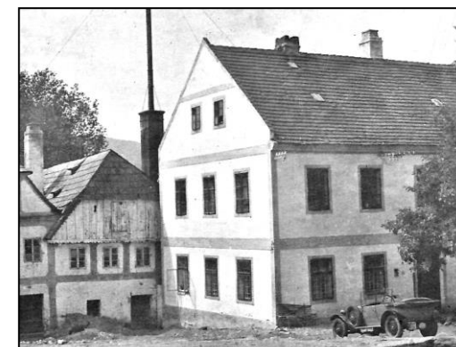
ZDE VE STRÁŽOVĚ POSLEDNÍ ŽIDOVSKÁ RODINA PROVOZOVALA KOŽELUŽNU

Tak zanikla židovská osada ve Strážově po šestisetletém trvání. Židovské domy následkem vystěhování židů ze Strážova přešly do křesťanských rukou.