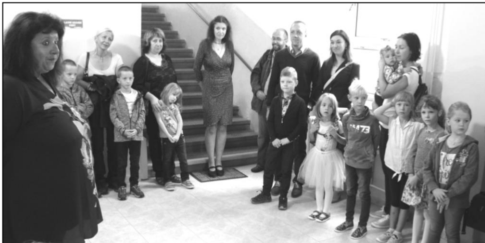
SLAVNOSTNÍ PŘIVÍTÁNÍ PRVNÁČKŮ

✓ 2. 9. 2019 začal nový školní rok 2019/2020