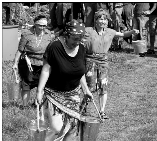
OPÁLECKÉ CIKÁNKY JDOU DO BOJE S OHNĚM