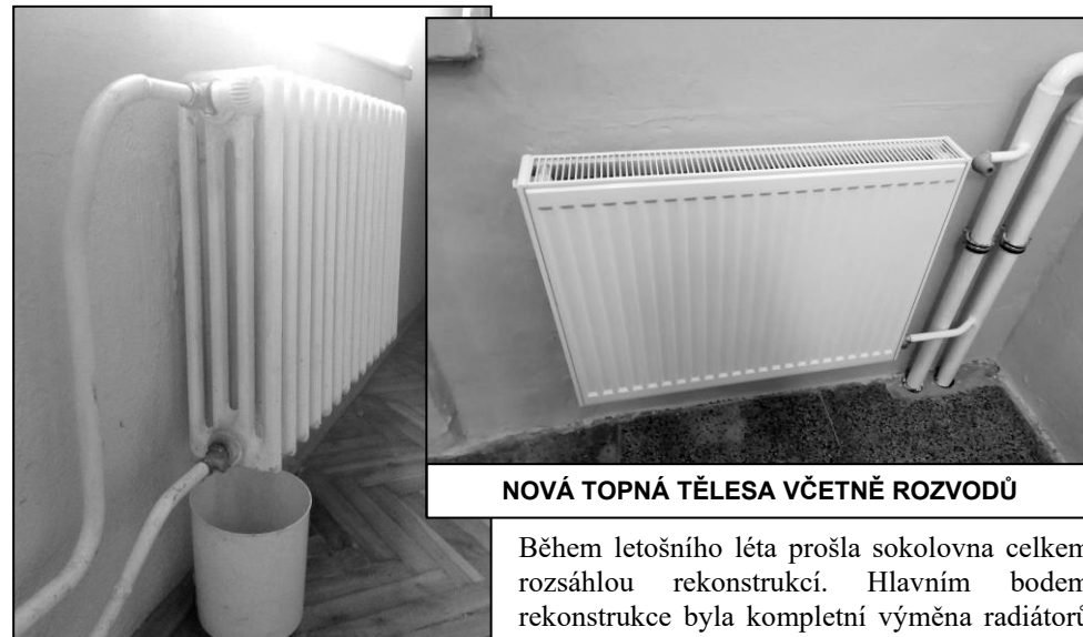
NOVÁ TOPNÁ TĚLESA VČETNĚ ROZVODŮ