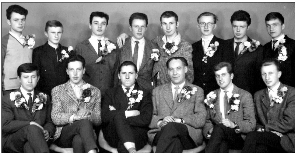
ŠESTAČTYŘICÁTÝ ROČNÍK NA SPOLEČNÉ FOTOGRAFII PŘI ODVODU