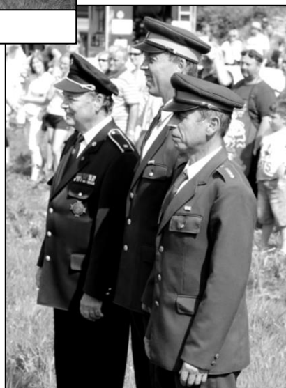
SLAVNOSTNÍ ZAHÁJENÍ A NÁSTUP DRUŽSTEV