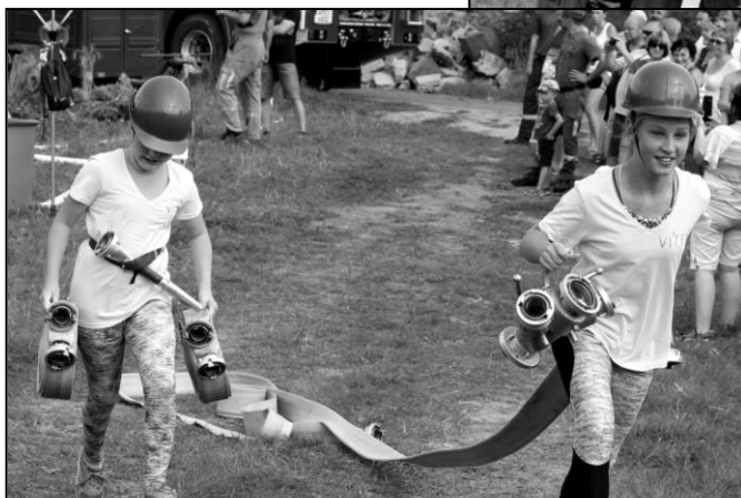
MLADÍ HASIČI Z VITNĚ