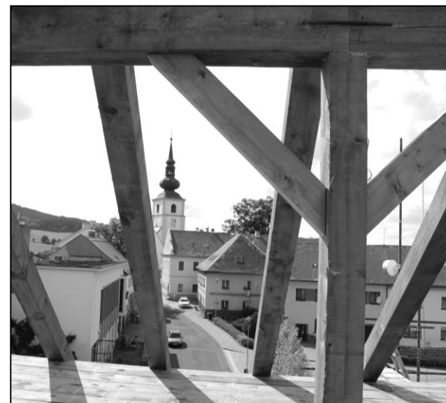
NA KROV JSME POUŽILI DŘEVO Z MĚSTSKÝCH LESŮ

Současně byla také položena nová dlažba na chodníku při škole a upraven vjezd na školní pozemek. Problémy s vlhkostí v tělocvičně přetrvávaly mnoho let. Pevně věříme, že zvolený technologický postup byl správný, práce provedeny kvalitně a tělocvična bude vhodným prostředím pro sportovní aktivity dětí. Celkově nás akce stála přes 3,2 mil. korun, přičemž cca 30 % bylo hrazeno z dotačních prostředků.