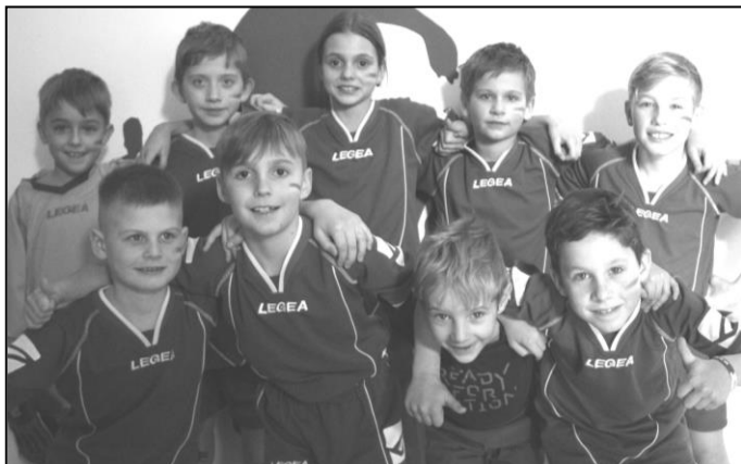
ÚSPĚŠNÍ REPREZENTANTI ZE STRÁŽOVA

V sobotu 2. února 2019 se mladší příprava ze Strážova vypravila na turnaj do německého Waldkirchenu. Akci jsme pojali velkolepě. Abychom si i my, rodiče, vše patřičně užili a podpořili naše malé fotbalisty, vypravili jsme autobus, vyrobili povzbuzující transparenty, namalovali si klubové barvy na obličeje a v časných ranních hodinách vyrazili. Oslabení o dva hráče,