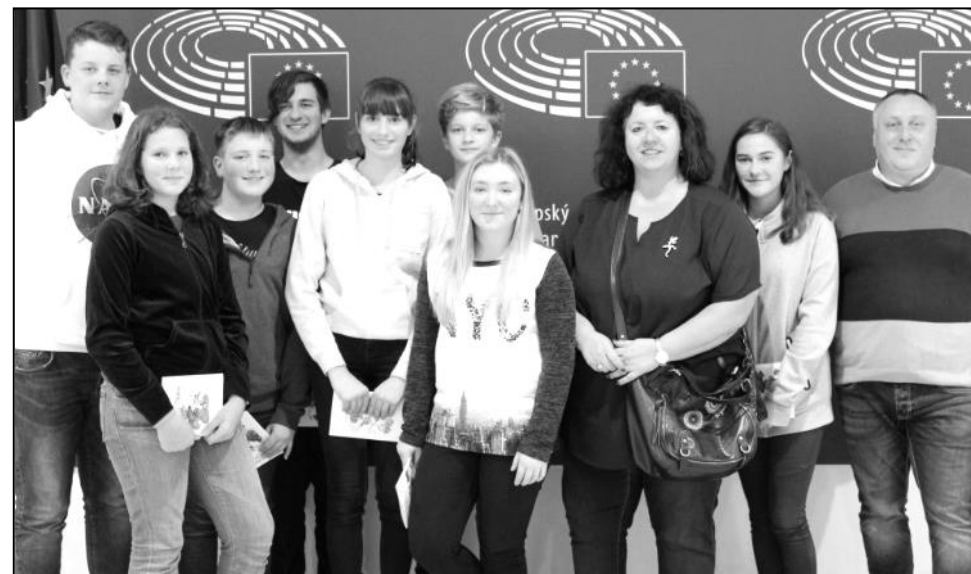
STRÁŽOVSKÁ SKUPINA V PROSTORÁCH EVROPSKÉHO PARLAMENTU