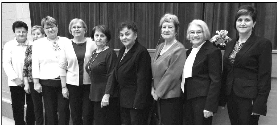
ÚČASTNICE SLAVNOSTNÍ PROMOCE NA ČESKÉ ZEMĚDĚLSKÉ UNIVERZITĚ V PRAZE