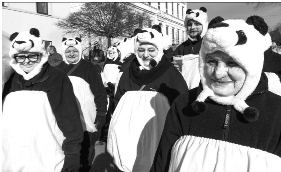
VELMI POČETNÁ BYLA SKUPINKA PAND