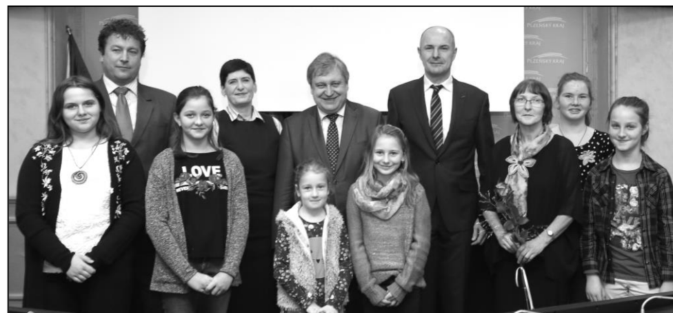
SPOLEČNÉ FOTO S HEJTMANEM A ČLENY RADY PLZEŇSKÉHO KRAJE