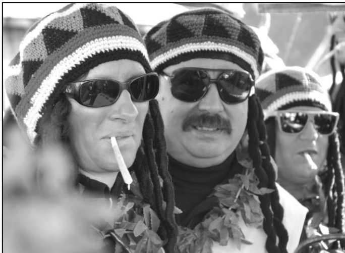
OKOLO TÉTO PARTIČKY BYLO NEJVÍCE CÍTIT VŮNI MARIHUANY

Již devátý ročník strážovského masopustního průvodu opět zabodoval. Jako tradičně jsme měli objednané příjemné slunečné počasí. Nic tedy nebránilo tomu, aby na vydařenou akci přišlo cca 350 masek a davy přihlízejících. Malinko zeslábl počet větších skupinek, ale průvod doplnili příchozí ze širokého okolí. K vidění bylo opět mnoho originálních nápadů. Velikou pozornost diváků si vysloužila pobřežní hlídka i početní zástupci z řad živočišné říše – papoušci či pandy. Rádi bychom touto cestou poděkovali všem, kteří svojí účastí přispívají ke slávě strážovského masopustního průvodu. Příští rok nás čeká jubilejní desátý ročník – již teď můžeme všichni přemýšlet, čím překvapit a jak nejlépe oslavit deset let strážovských masopustů.