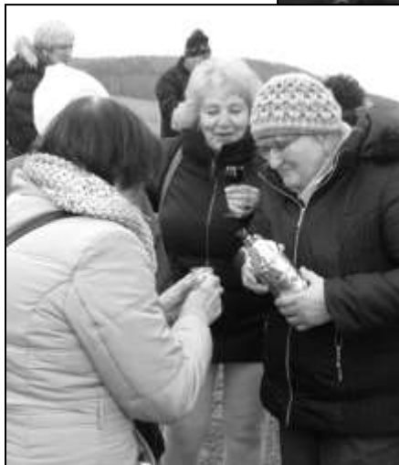
SENIORI SE SEŠLI NA NÁMĚSTÍ ODKUD ŠLI NA VYHLÍDKU