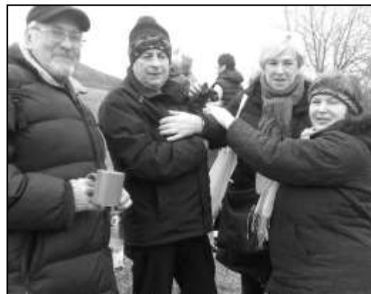
ÚČASTNÍCI SI SPOLEČNĚ PŘIPILI NA ZDRAVÍ V NOVÉM ROCE