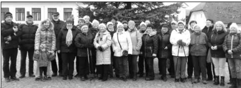
DRUHÉHO ROČNÍKU SILVESTROVSKÉHO PŘÍPITKU SE ZÚČASTNILY VÍCE NEŽ TŘI DESÍTKY MÍSTNÍCH SENIORŮ