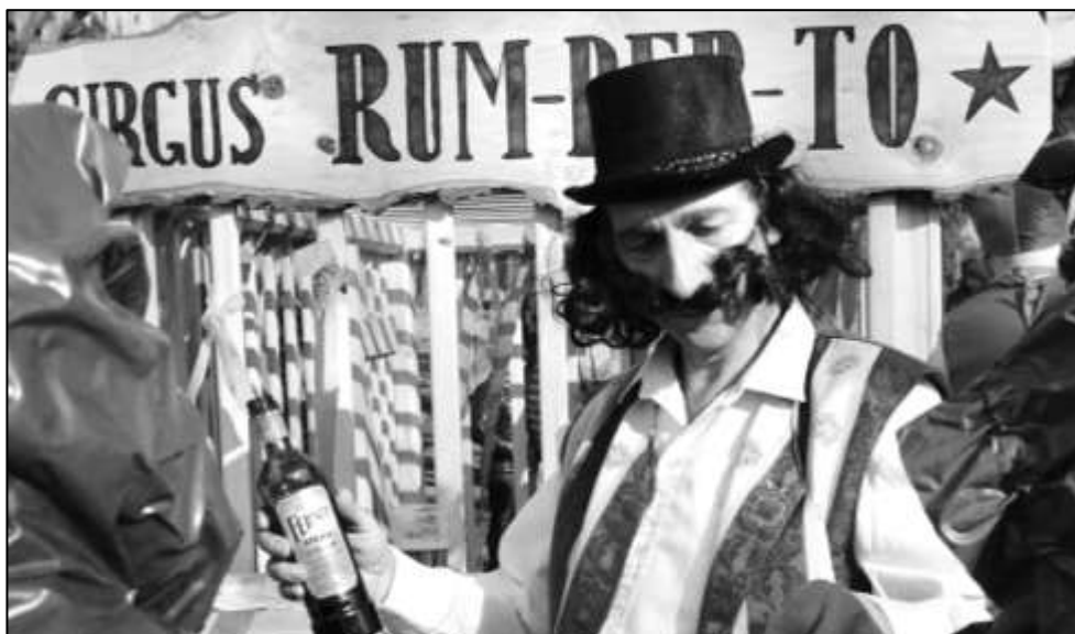
PRINCIPÁL KOČOVNÉHO CIRKUSU RUM-BER-TO

Jubilejní desátý ročník strážovského masopustního průvodu opět potvrdil, že se jedná o jedinečnou akci s mimořádně velikou účastí. Průvodu, který jako každoročně čítal okolo 350 masek, na cestu krásně svítilo sluníčko. Nebývale veliká byla účast diváků, těch k nám letos přijelo několik stovek z různých koutů Klatovska. V průvodu bylo jako tradičně k vidění mnoho originálních masek. Nejpočetnější skupinku přivedla viteňská Sněhurka, kterou doprovázely více než čtyři desítky trpaslíků. Úžasný byl cirkus RUM-BER-TO, stádo zeber i veliká skupinka mravenců z Dešenic. Rádi bychom touto cestou poděkovali všem, kteří svojí účastí přispívají k obrovskému vřelému strážovského masopustního průvodu.