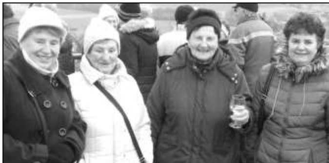
AKCI POŘÁDAL MÍSTNÍ KLUB SVAZU ZDRAVOTNĚ POSTIŽENÝCH