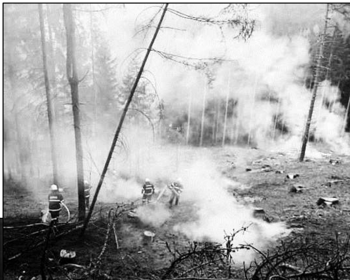
NEDÁVNÝ POŽÁR LESA V DATELOVĚ, KDE ZASAHovali TAKÉ STRÁŽOVŠTÍ HASIČI

Díky jednoduchému formuláři mají hasiči dokonalý přehled, na jakých místech a kdy