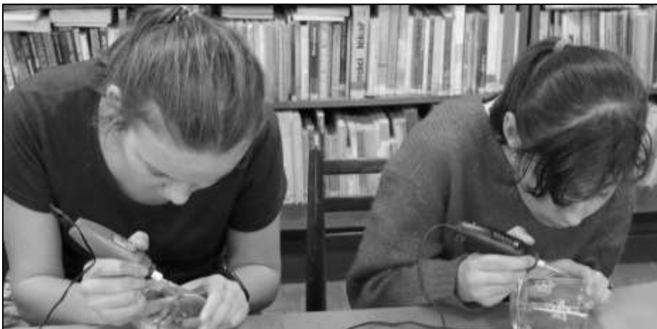
MÍSTNÍ DĚVČATA ZABRANÁ DO BROUŠENÍ SKLENÍČEK