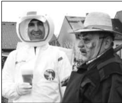
RUSKÝ KOSMONAUT SOUKUPOV SE SNAŽÍ DOROZUMĚT S MÍSTNÍM DOMORODCEM

Jubilejní desátý ročník strážovského masopustního průvodu opět potvrdil, že se jedná o jedinečnou akci s mimořádně velikou účastí. Průvodu, který jako každoročně čítal okolo 350 masek, na cestu krásně svítilo sluníčko. Nebývale veliká byla účast diváků, těch k nám letos přijelo několik stovek z různých koutů Klatovska. V průvodu bylo jako tradičně k vidění mnoho originálních masek. Nejpočetnější skupinku přivedla viteňská Sněhurka, kterou doprovázely více než čtyři desítky trpaslíků. Úžasný byl cirkus RUM-BER-TO, stádo zeber i veliká skupinka mravenců z Dešenic. Rádi bychom touto cestou poděkovali všem, kteří svojí účastí přispívají k obrovskému vřelému strážovského masopustního průvodu.