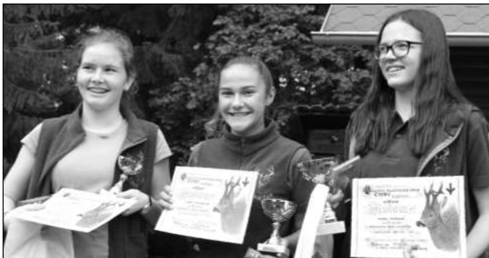
TŘI NEJÚSPĚŠNĚJŠÍ DÍVKY VE STARŠÍ KATEGORII