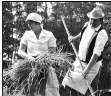
VZPOMÍNKA NA DOŽÍNKY, KTERÉ SE USKUTEČNILY V ROCE 2013

Na konec srpna letošního roku připravují hasiči z Opálky ve spolupráci s městem opakovaní velice vydařené dožínkové akce. Konkrétně 25. srpna 2018 si na hasičském cvičišti ve Strážově připomeneme bohatou zemědělskou tradici našeho kraje. Nadšenci historické zemědělské techniky z Opálky již dávají do chodu staré zemědělské stroje a náčiní, které návštěvníkům připomenou staré způsoby zpracování obilí. Součástí bohatého odpoledního programu na hasičském cvičišti bude také ukázka práce s koňmi, které k venkovu a zemědělství odjakživa patřili. V souvislosti s touto akcí připravujeme fotoknihu dokládající zemědělské hospodaření na Strážovsku. Máte-li doma staré snímky z bachlování či mašínování obilí, práce s koňmi na polích, pasení dobytka nebo jiné zajímavé fotografie, budeme za ně vděční. Po naskenování je samozřejmě vrátíme.