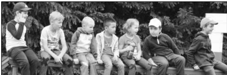
BUDOUCÍ HASIČI PEČLIVĚ SLEDUJÍ VÝKONY JEDNOTLIVÝCH DRUŽSTEV