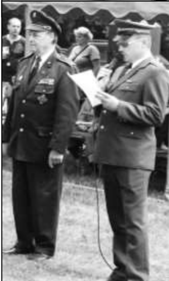
STAROSTA SDH ROVNÁ SE STAROSTOU OKRSKU