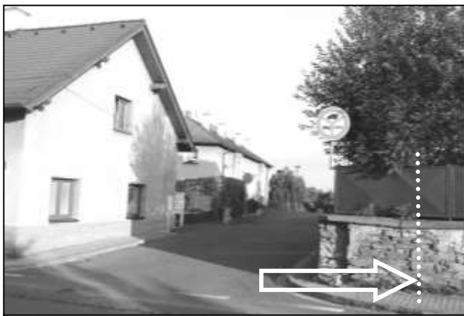
NEJUŽŠÍ MÍSTO SILNICE NA PANDROUSKU A ZOBRAZENÍ ROZŠÍŘENÍ KŘÍŽOVATKY