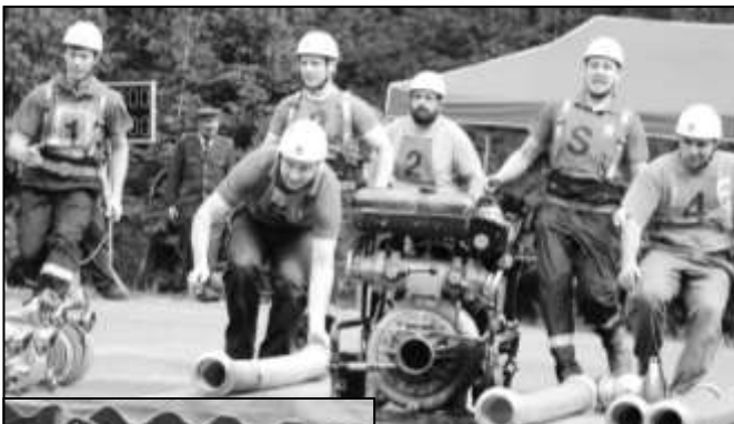
HASIČI ZE STRÁŽOVA PŘI ÚTOKU

19. května 2018 hasičské cvičiště ve Strážově