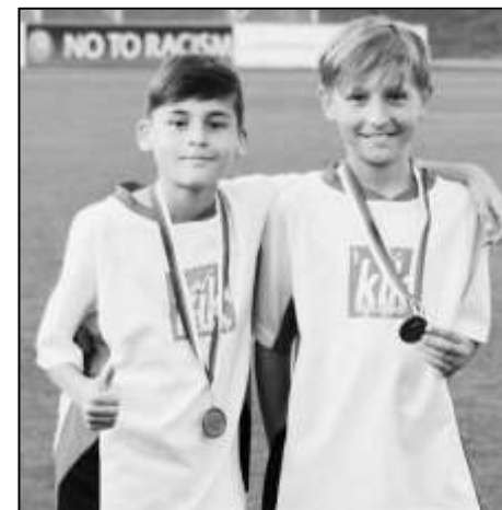
DVA MLADÍ FOTBALISTÉ ZAŘAZENÍ DO OKRESNÍHO VÝBĚRU