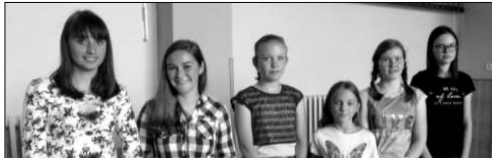
ÚČASTNICE SOUTĚŽE MLADÝ ZAHŘÁDKÁŘ A FLORISTICKÉ SOUTĚŽE