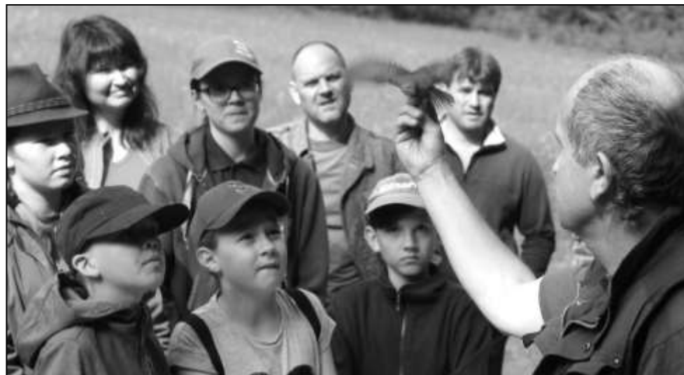
DĚTI NAPJATĚ SLEDUJÍ VYPOUŠTĚNÍ ODCHYCENÉHO JEDINCE

Třetí květnovou sobotu pak myslivci uspořádali u myslivecké chaty již tradiční venkovní přednášku ornitologa a zoologa Ing. Jiřího Vlčka. Na programu byly ukázky odchyty, kroužkování a určování ptactva v terénu včetně praktického předvedení odchyťových zařízení. Pro děti byly připraveny poznávací hry o přírodě a ukázky různých přírodnin.