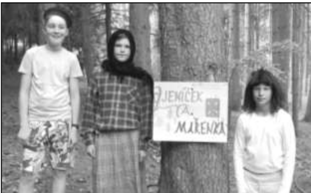
NA STANOVIŠTI U JENIČKA S MAŘENKOU