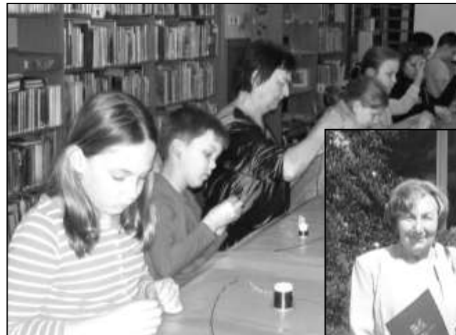
ÚČASTNÍCI JEDNOHO Z KURZŮ

Korálkové jaro - Sluníčko nás po zimě dostává zpět do kondice a dodává nám chuť k tvořivosti. Drobné odlesky slunečních paprsků můžeme spatřit také v korálcích. Z tohoto důvodu patřilo jarní období v místní knihovně převážně korálkům. Bylo uspořádáno několik výtvarných dílen pro děti, mládež i dospělé – Náramek