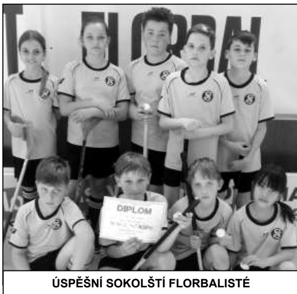
ÚSPĚŠNÍ SOKOLŠTÍ FLORBALISTÉ

Florbalisté Sokola Strážov si ve cvičebním roce 2017/2018 vedli úspěšně v Přeboru Sokolské župy Šumavské. Jednota přihlásila tradičně do přeboru družstva ve všech čtyřech kategoriích. Všechna se umístila na medailových pozicích. Přebor byl organizován formou 2 turnajů pro každou kategorii, na každém turnaji se hrálo systémem každý s každým. V kategorii mladších i starších žáků skončili naši hráči vždy na druhém místě za vítěznými družstvy Sokola Švihov. Společně