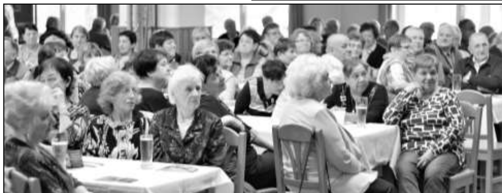
SÁL SOKOLOVNY OPĚT PO ROCE ZAPLNILI POZVANÍ SENIOŘI ZE STRÁŽOVSKA