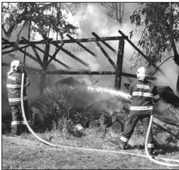
HASIČI PŘI ZÁSAHU U POŽÁRU V ZAHORČICÍCH

V posledních týdnech se Strážovskem několikrát rozezvučela požární siréna. Místní dobrovolní hasiči opakovaně vyjžděli k popadaným stromům, které bránily provozu na pozemních komunikacích. Jindy byl cílem výjezdu jednotky hořící automobil na cestě ze Strážova na Patrasku. Poplach měli místní hasiči vyhlášen také v neděli 30. září. To vyjžděli k požáru dřevěné kůlny v Zahorčicích, kde zasahovali společně s tamními dobrovolnými hasiči. Požár dřevostavby, která sloužila k uskladnění dřeva, vznikl z nedbalosti nedohašením nedalekého ohniště po spalování větví a listů.