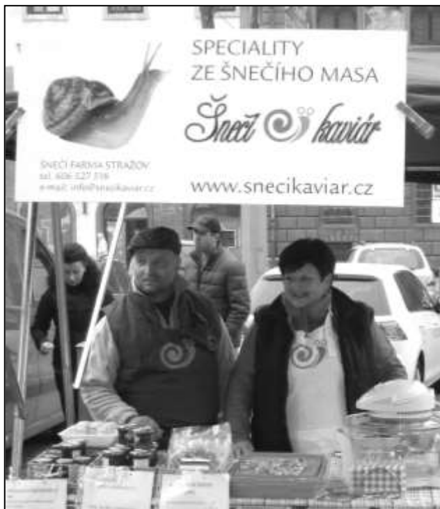
STÁNEK SE ŠNEČÍMI SPECIALITAMI NA FARMÁŘSKÝCH TRŽÍCH V PLZNI

Od července letošního roku rozšířili strážovští podnikatelé výrobu o speciality ze šnečího masa. Zákazník si může zakoupit buď hotové šneky po burgundsku, které stačí rozbalit a vložit do přehřáté trouby na 8–10 minut, nebo si může zájemce o kulinářské lahůdky zakoupit menší balení šnečího masa (24 kusů) v hovězím či zeleninovém vývaru pro přípravu dle vlastní invence (např. šnečí špíz, rizoto, šnečí v trojbalu...). Novinkou je pak šnečí paštika s brusinkami.