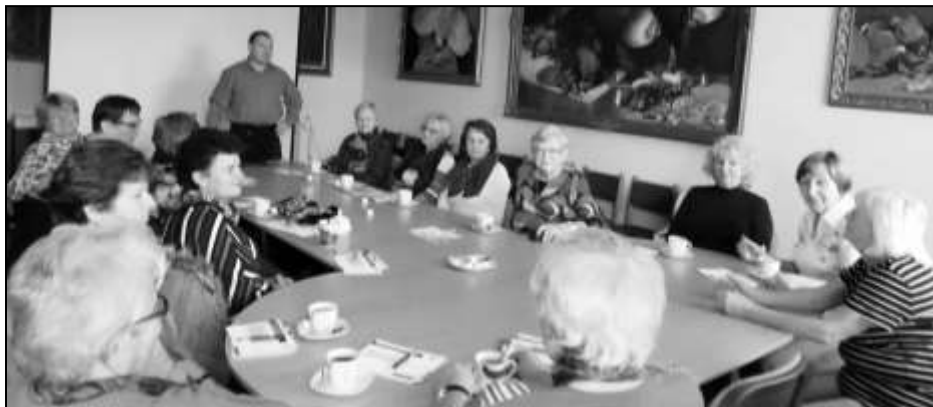
SENIORKY PŘI BESEDĚ NA TÉMA FINANČNÍ GRAMOTNOST A RODINNÉ PRÁVO