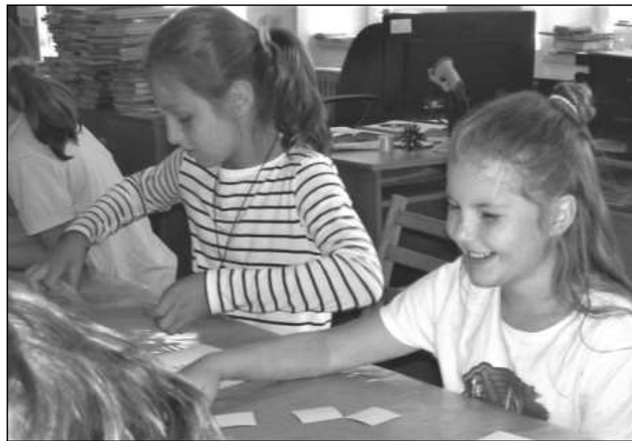
DĚVČATA Z VITNĚ PŘI JEDNÉ Z AKCÍ V MÍSTNÍ KNIHOVNĚ