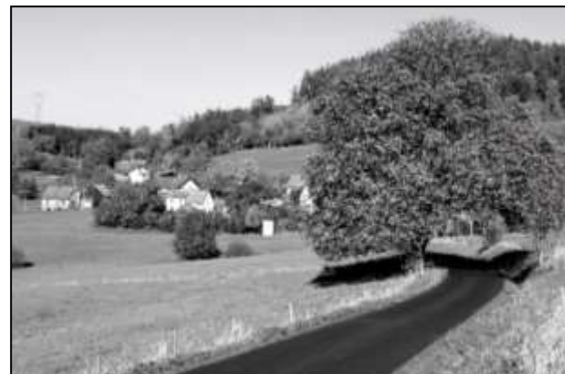
SILNIČKA SPOJUJÍCÍ STRÁŽOV A LEHOM

Kromě běžných menších oprav povrchů silnic proběhly v letošním roce na Strážovsku dvě významnější rekonstrukce místních komunikací.