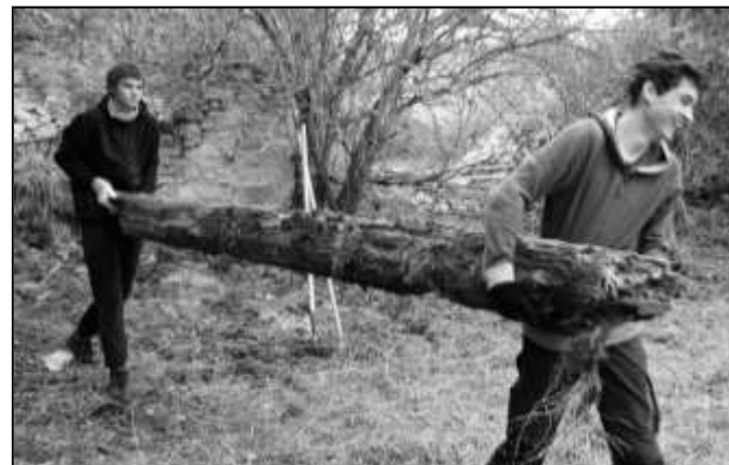
RUKU K DÍLU PŘILOŽILI TAKÉ MLADÍ STRÁŽOVÁCI

Akce byla zakončena příjemným posezením s bohatým pohoštěním, jehož zlatým hřebem bylo opečené prasátko. Přejme nové majitelce mnoho elánu a síly při další práci na obnově opálecké tvrze.