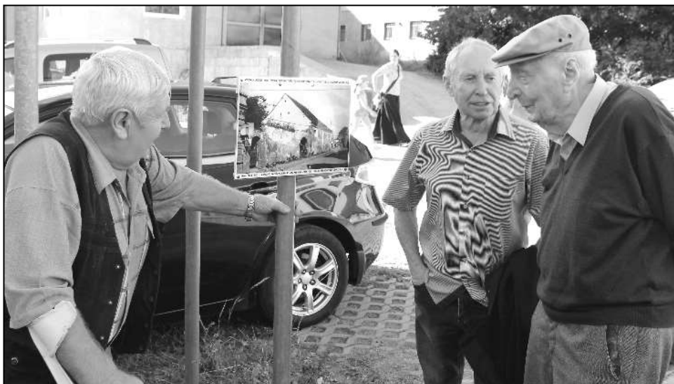
PAMĚTNÍCI VZPOMÍNÁJÍ U FOTOGRAFIE BÝVALÉHO HOSTINCE „U SOUKUPŮ“