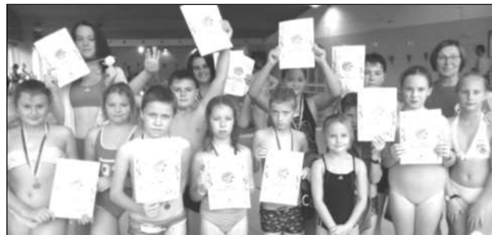
VELEÚSPĚŠNÁ VÝPRAVA STRÁŽOVSKÝCH PLAVCŮ

Během podzimního plavání, které se konalo v Sušici dne 3. 11. 2018, měl TJ Sokol Strážov 14členné zastoupení z celkového počtu 61 zúčastněných. Naši sportovci soutěžili ve třech věkových kategoriích a slavili velký úspěch. O tom svědčí i počet získaných medailí. Ze 14 zúčastněných je zisk 13 medailí opravdu na velikou jedničku.