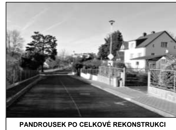
PANDROUSEK PO CELKOVĚ REKONSTRUKCI

Druhou významnou stavební akcí letošního roku byla celková rekonstrukce místní komunikace na Pandrousku ve spojení s výměnou vodovodu a kanalizace. Souběžně pak byla provedena též překládka vzdušného elektrického vedení do země a osazeno nové veřejné osvětlení. V rámci této akce bylo navíc zajištěno nové oplocení u mateřské školy a také posunuta hraniční zeď u výjezdu na hlavní silnici. Celkový rozpočet investiční akce přesáhl 7,5 mil. Kč, přičemž na opravu kanalizace nám přispěl Plzeňský kraj. U této stavby, kterou realizovala klatovská firma VAK SERVIS s.r.o., zdárně proběhlo 27. 11. 2018 kolaudační řízení.