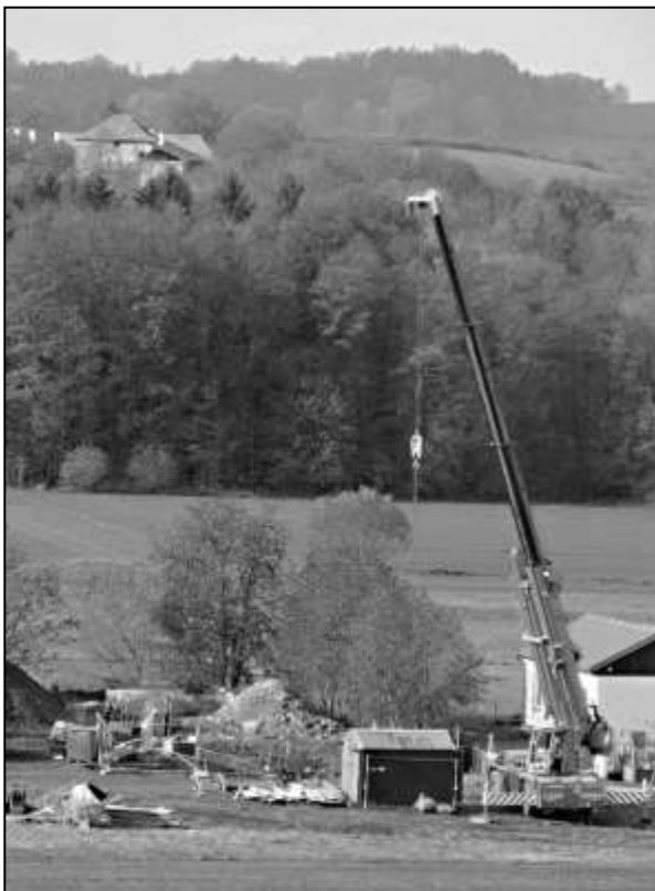
ČILÝ STAVEBNÍ RUCH U ČISTÍRNY

Možná jste si všimli, že okolo strážovské čistírny odpadních vod je v poslední době nebývale rušno. Příčinou je skutečnost, že zde probíhají stavební práce spočívající v technologickém rozšíření provozu. Konkrétně je upravován nátok do čistírny. Hlavním přínosem stavby bude dokonalejší odstranění mechanických nečistot (zejména písku a štěrku). Jejich vysoký obsah v odpadní vodě je zapříčiněn jednotným kanalizačním systémem a při nátoku do čerpací stanice dochází k vysokému opotřebení a poruchovosti čerpadel. Dále zde bude efektivněji řešena regulace vtoku do čistírny. Celková investice je velmi vysoká (přesáhne 4,5 mil. korun), ale naštěstí se nám podařilo získat finanční dotaci od Plzeňského kraje, a ta pokryje zhruba polovinu investičních nákladů. Stavbu provádí klatovská společnost VODOSPOL, která je zároveň provozovatelem čistírny.