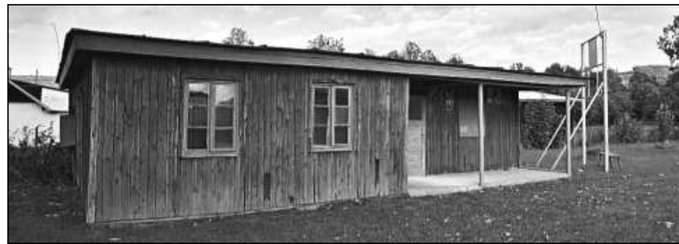
BÝVALÁ CELNICE SLOUŽILA PO DLOUHÁ LÉTA JAKO FOTBALOVÉ KABINY