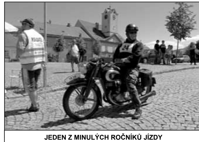
JEDEN Z MINULÝCH ROČNÍKŮ JÍZDY

Mezinárodní Jízda Klatovskem historických vozidel odstartuje v sobotu 9. června z Eurocampu Běšiny. Na automobilové a motocyklové veterány čeká trať v okolí Klatov a podhůřím Šumavy o délce 96 km, 5 dovednostních zkoušek, 1 jízda zručnosti na čas a 2 průjezdní kontroly. Startovní pole je velmi různorodé, více jak třetina strojů bývá vyrobena před rokem 1945. Pro diváky jsou velice atraktivní místa zkoušek. Na nich mohou sledovat, jak si řidiči vedou při jejich absolvování a v klidu si prohlédnout všechna historická vozidla, která v Jízdě Klatovskem odstartují. Ve Strážově na náměstí bude jedna z těchto zkoušek a předpokládaný příjezd prvního vozidla je ve 13.50 hod. Soutěž pořádá a diváky na podávání zve Historic club PAMK Klatovy.