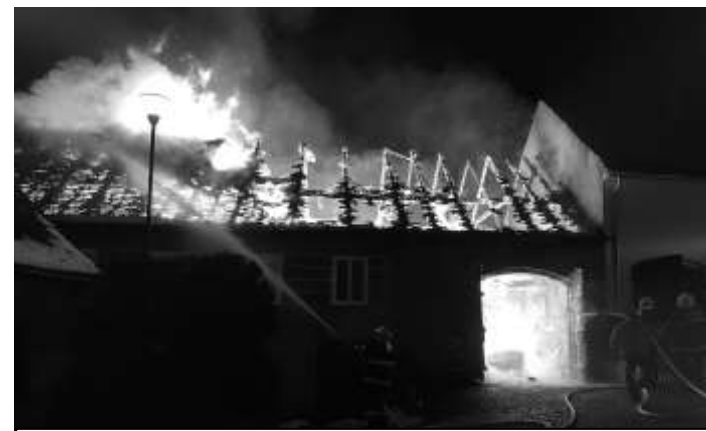
S POŽÁREM BOJOVALO SEDM HASIČSKÝCH JEDNOTEK

bojovalo sedm hasičských jednotek (profesionální hasiči z Klatov a dobrovolné hasičské sbory ze Strážova, Vitně, Běhařova, Běšin, Lub a Janovic nad Úhlavou). Požárem byla prvotně zasažena stodola, v níž stály dva osobní vozy, odtud se však oheň ještě před příjezdem hasičů rozšířil na přilehlou obytnou budovu a zasáhl podkroví a střechu. I u obytné části došlo následně k propadání stropů. Sousední objekty se hasičům podařilo naštěstí uchránit, stejně tak se díky obětavosti hasičů povedlo vynosit a zachránit část vybavení domácnosti hořícího domu. S následným zajištěním objektu a prvotním úklidem hned odpoledne kromě dobrovolníků pomáhali členové všech našich jednotek (Strážov, Vitně, Zahorčice a Opálka).