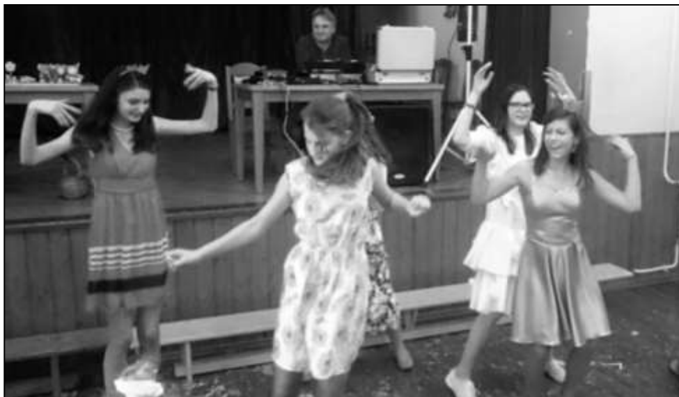
STARŠÍ DĚVČATA PŘEDVEDLA BOUŘLIVÉ TANEČNÍ KREACE

V sobotu 7. dubna se ve strážovské sokolovně uskutečnily dětské šibřinky. I za slunečného odpoledne si přišlo do sálu zatančit a zasoutěžit více než 50 dětí od nejmenších kominíčků, trpaslíčků a víl až po již téměř dospělé princezny, které pomáhaly se zajištěním soutěžních disciplín. Doprovod jim dělal stejný počet rodičů, prarodičů, tet a strýčků, kteří s nadšením sledovali rej zajímavých a krásných masek. Po několikahodinovém tanečním a soutěžním maratonu, který hudbou doprovodil DJ Žebro, byly vyhodnoceny nejpovedenější masky i taneční kreativita všech účastníků šibřinek, kteří si opravdu první dubnové sobotní odpoledne náležitě užili.