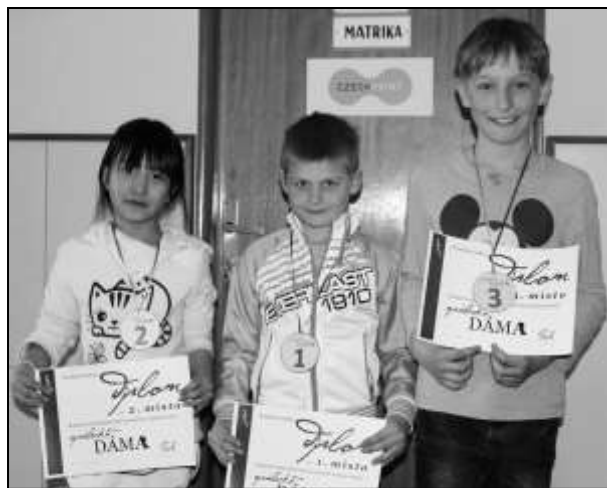
TŘI NEJLEPŠÍ V KATEGORII NEJMLADŠÍCH ŽÁKŮ