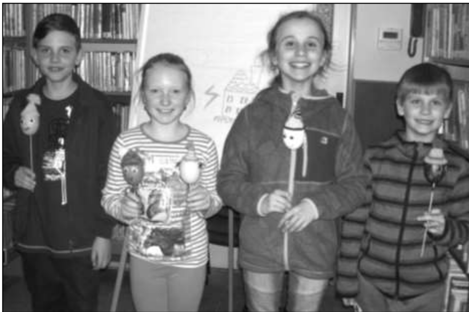
ÚČASTNÍCI JEDNOHO Z KURZŮ S VYROBENÝMI VAJÍČKY S ČEPIČKOU

pořádání kulturních, hasičských a jiných akcí. Vlek byl svěřen do užívání Sboru dobrovolných hasičů ve Strážově, který na vlastní náklady provádí úpravu vleku. Ten bude k dispozici i pro potřeby ostatních spolků.