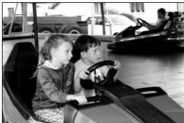
POUŤ BÝVÁ RÁJEM VŠECH DĚTÍ, KTERÉ SI ATRAKCE NÁLEŽITĚ UŽÍVÁJÍ

→ Velice bohatý bude o pouťovém víkendu program fotbalových utkání na hřišti SK Kovodružstva Strážov . V sobotu od 10.00 hod. se zde uskuteční turnaj starší přípravky, odpoledne od 16.00 hod. pak proběhne utkání staré gardy, které bude pojato jako souboj dvou týmů složených z bývalých místních hráčů. V neděli od 10.00 hod. odehrají svůj soutěžní zápas mladší žáci proti vrstevníkům ze Železné Rudy. Mužské „áčko“, které je na druhém místě okresního přeboru, se utká v neděli od 16.00 hod. s týmem FK Svěradice B.