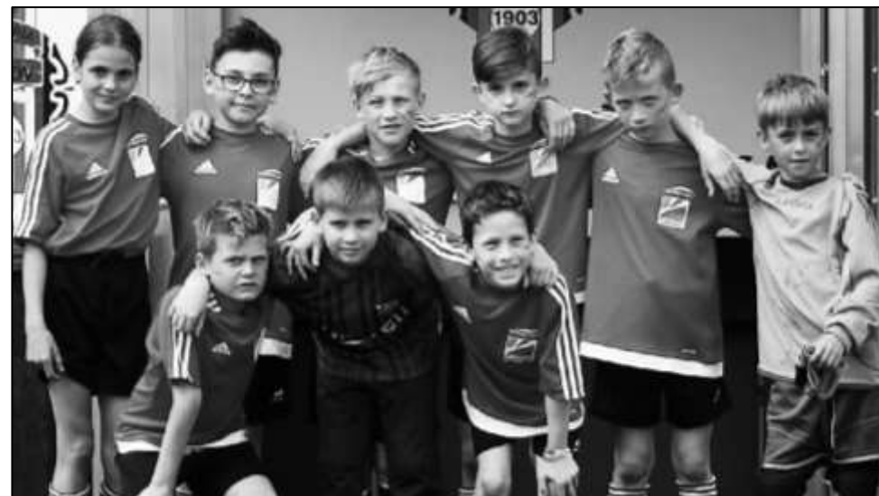
MALÍ FOTBALISTÉ SI PŘIVEZLI Z PRAHY NEZAPOMENUTELNÉ ZÁŽITKY