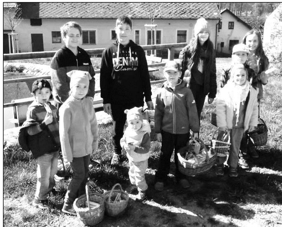
TRADICE VELIKONOČNÍ POMLÁZKY JE JEDNÍM Z KRÁSÝCH ZVYKŮ, KTERÉ SE DODNES UDRŽUJÍ NA ČESKÉM VENKOVĚ. SNÍMEK, KTERÝ NÁM ZASLALA KATEŘINA BOHUSLAVOVÁ, ZACHYCUJE KOLEDNÍKY NA LUKAVICKÉ NÁVSI.

Předběžně předpokládáme, že zhruba za dva až tři roky by mohly být stavební parcely připraveny k výstavbě rodinných domů pro trvalé bydlení. Již nyní na radnici vedeme seznam zájemců o budoucí výstavbu. Uvažujete-li se ve Strážově usadit, neváhejte a přijďte se informovat na bližší podrobnosti!