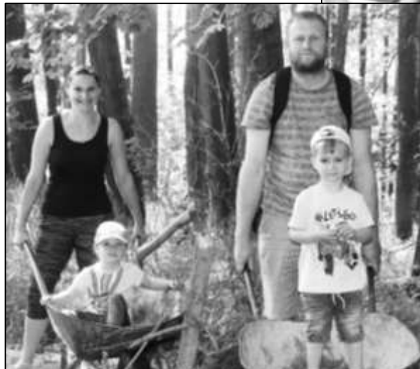
ÚČASTNÍCI DĚTSKÉHO DNE PŘI PLNĚNÍ ÚKOLŮ