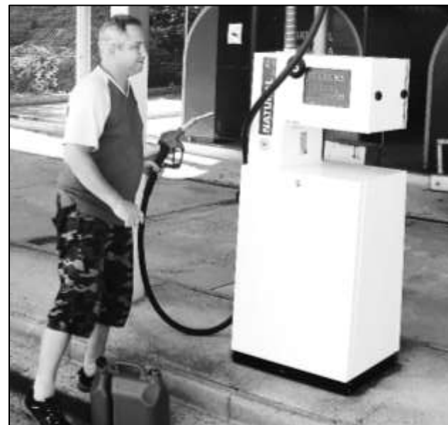
MODERNÍ VÝDEJNÍ STOJANY JSOU NOVOU CHLOUBOU STRÁŽOVSKÉ ČERPACÍ STANICE

Jak většina z Vás asi ví, zajišťuje město Strážov prostřednictvím společnosti Strážovská čerpací stanice s. r. o. provoz místní čerpací stanice pohonných hmot. Přestože provozovna je vzhledem k nízkým obchodním maržím v posledních letech v lehké ekonomické ztrátě, bereme její fungování jako jednu z důležitých služeb pro občany našeho města. Proto se také zastupitelstvo rozhodlo zainvestovat nákup nových výdejních stojanů. Ty staré totiž pomalu dosluhovaly a vysoká poruchovost zvyšovala náklady na jejich nutné opravy. Dodavatelem nových stojanů byla znojemská firma UNIDATAZ s. r. o. Za dva