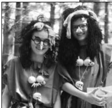
ČARODĚJNICE BYLY HODNÉ A ROZDÁVALY BONBÓNY