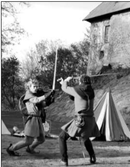
VYSTOUPENÍ ŠERMÍŘSKÉ SKUPINY