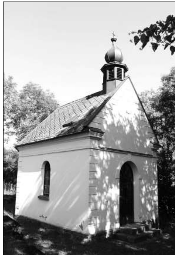
SOUČASNÁ PODOBA LUKAVICKÉ KAPLIČKY