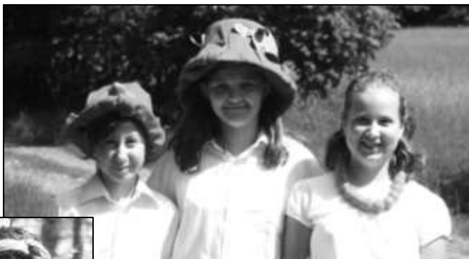
RUMCAJS S MANKOU A CIPÍSKEM