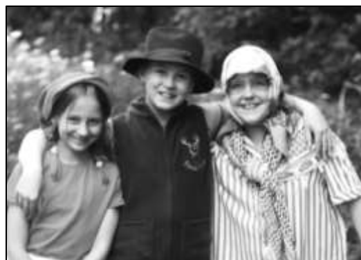
ČERVENÁ KARKULKA S MYSLIVCEM A BABIČKOU