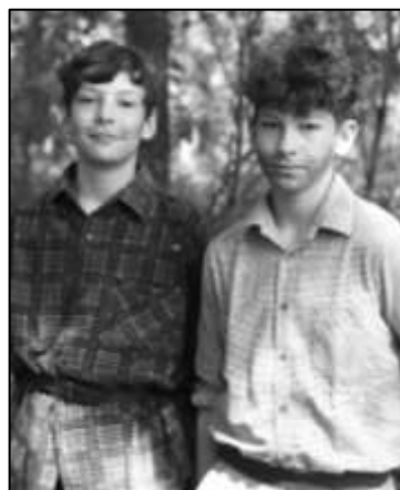
LOUPEŽNÍCI Z OPÁLKY