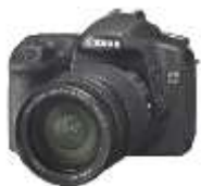
STRÁŽOVSKÝ HÁJ 23. května 2019