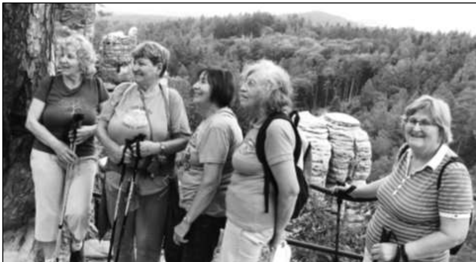
SKUPINKA STRÁŽOVSKÝCH TURISTEK NA JEDNÉ Z VYHLÍDEK V PRACHOVSKÝCH SKALÁCH

Oblíbené výlety strážovských turistů každý měsíc pravidelně přilákají několik desítek vyznavačů pěší turistiky. Nabídka výletů bývá pestrá, neboť turisté se vydávají do blízkého i vzdálenějšího okolí poznávat krásy malebného česko-bavorského pomezí. Jedenkrát ročně je navíc připraven třídní výlet. Letos se Strážováci vydali do Českého ráje, kde obdivovali krajinu vyšperkovanou mnoha pískovcovými skalními útvary. Program zavedl téměř čtyři desítky účastníků také na rozhlednu Kozákův, do mučírny hradu Kost i do údolí řeky Jizery v okolí Malé Skály. Další výlet spojený s táborákem se připravuje na 27. července. Zván je každý, kdo má chuť se projít. Bližší informace o výletech se dozvíte ve vývěsní skříňce na autobusové zastávce případně na webových stránkách www.turiste-strazov.webnode.cz .